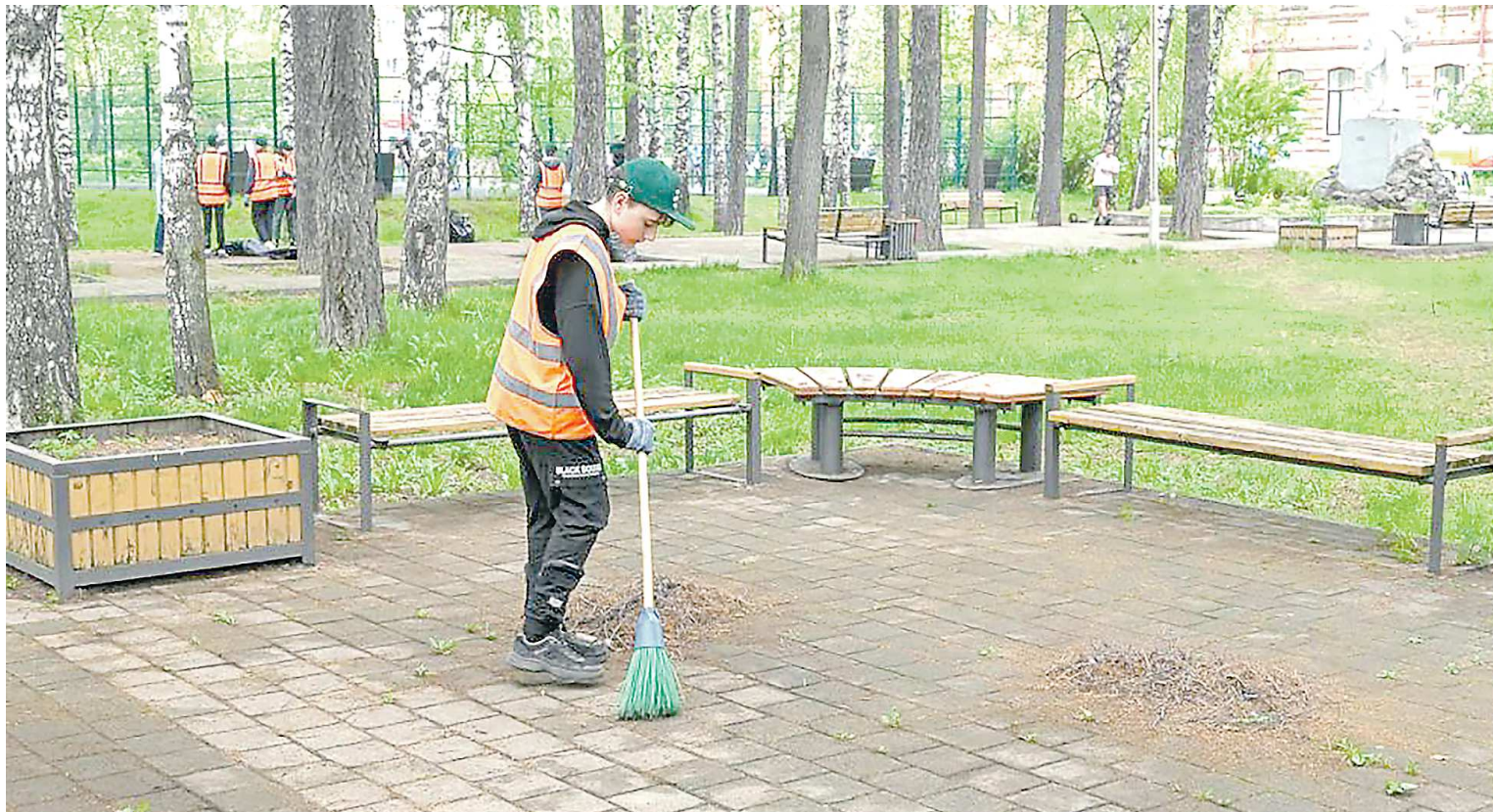
Почти 500 подростков были трудоустроены в Нижнем Тагиле за июнь

В Нижнем Тагиле с начала июня к работе приступили 39 трудовых отрядов мэра. Подростки вышли во все районы города, чтобы сделать его чище и красивее. Трудоустройство молодых тагильчан реализуется совместно с Городским дворцом молодежи. На организацию деятельности трудовых отрядов из местного бюджета выделено более 13 млн рублей.