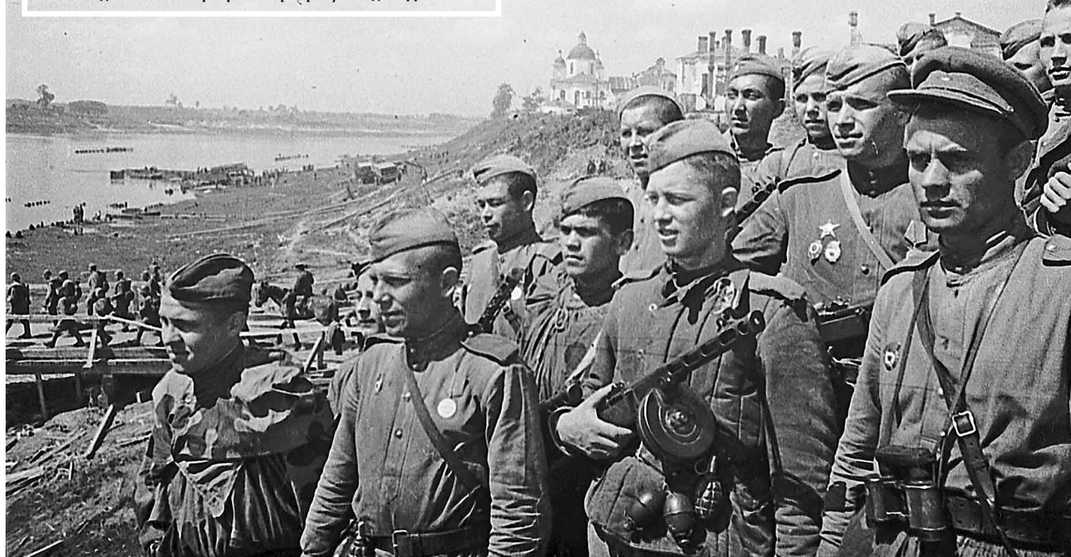
Белорусская стратегическая наступательная операция «Багратион» – (23 июня – 29 августа 1944 г.) сыграла ключевую роль в приближении Великой Победы. За 68 суток была освобождена Белорусская ССР и почти полностью разгромлена германская группа армий «Центр». Операция «Багратион» стала образцом полководческого искусства и одной из крупнейших военных операций за всю историю войн