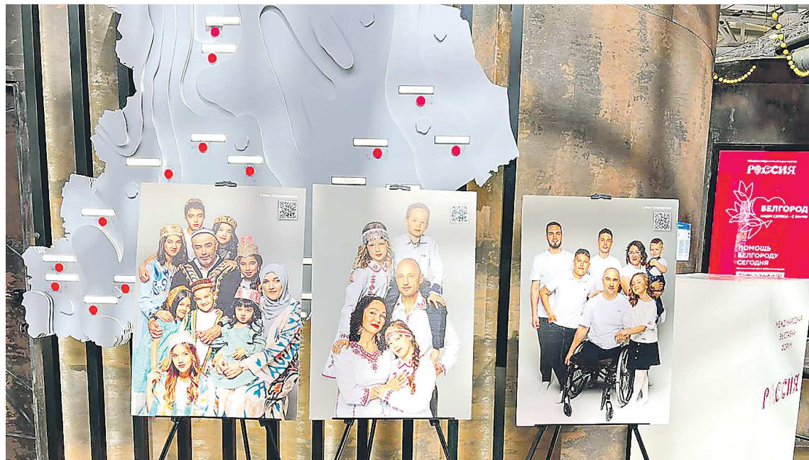
В Свердловской области проживает почти 70 тысяч многодетных семей

— Герои этой фотовыставки не летали в космос, не запускали атомные реакторы, не были героями светских хроник. Это наши соседи, друзья, попутчики, коллеги по работе. Все они де-