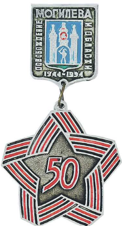
Памятный значок «50 лет освобождения Могилева»