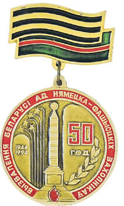
Памятный значок «50 лет освобождения Белоруссии»