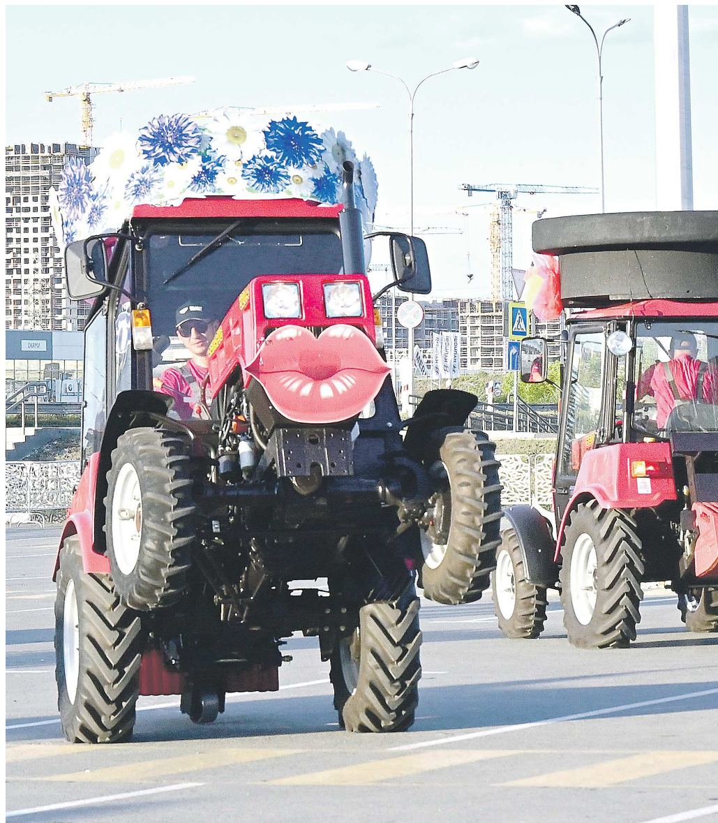
Свою продукцию и разработки на ИННОПРОМ-2024 покажут 24 белорусских предприятия