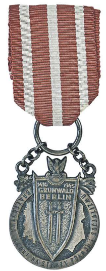
Медаль министерства обороны Польской Народной Республики «1410 Грюнвальд – 1945 Берлин. Братство по оружию на страже мира и социализма» (Л.А. Новогрудская была награждена как участник сражения под Ленино)

В России 2024 год – Год семьи. И так получается, что 80-летие освобождения Белоруссии – это у нас семейная история.