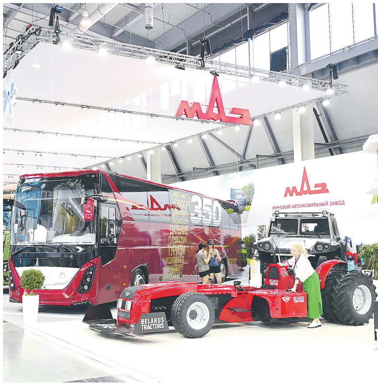
На ИННОПРОМ-2024 представят новинку под брендом MAZ

Как подчеркивают организаторы белорусской экспозиции, особенно важно, что многие разработки и продукция будут представлены впервые и с ними можно будет ознакомиться в течение всех дней работы ИННОПРОМ. На стендах предприятий работают профессиональные консультанты, представи-