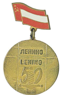
Памятная медаль «Ленино 50 лет. Первый совместный бой 12-13 X 1943»