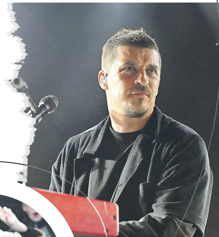
Выступление Антона Беляева и его группы Therr Maitz стало кульминацией фестиваля