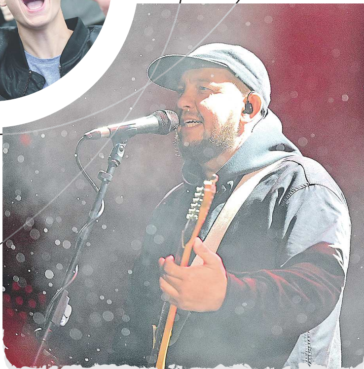
Вечно молодой Сергей Бобунец раскачал «Екатеринбург Арена»