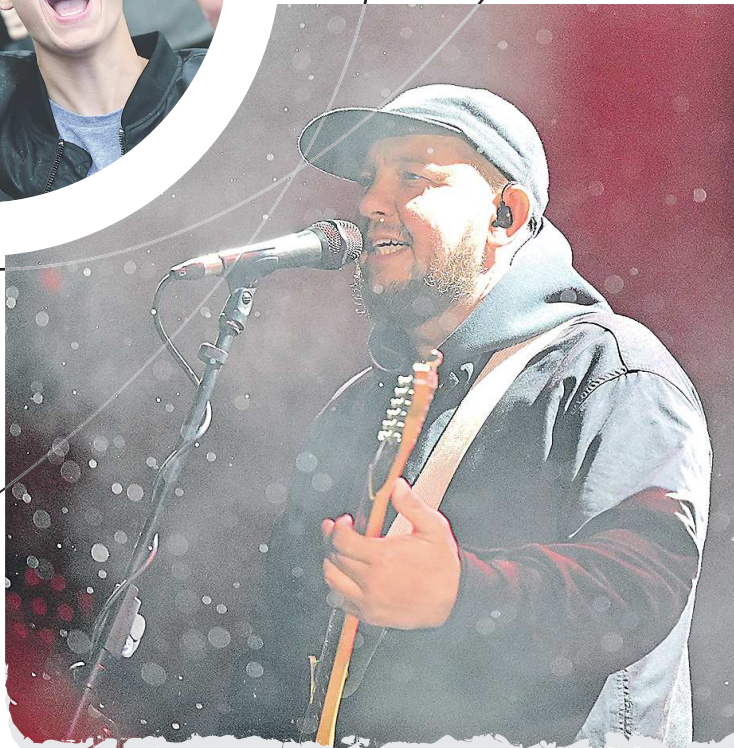
Вечно молодой Сергей Бобунец раскачал «Екатеринбург Арена»