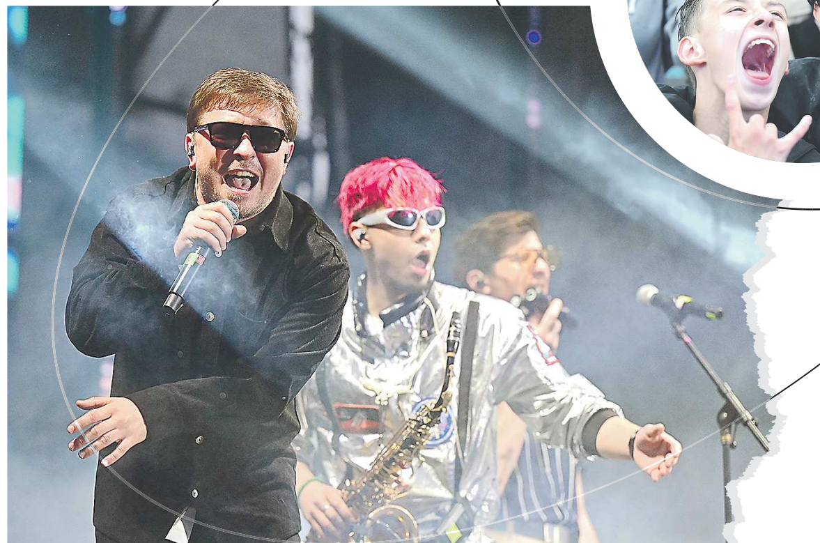
Группу «Сатисфаер» можно было послушать на «Капсуле времени»