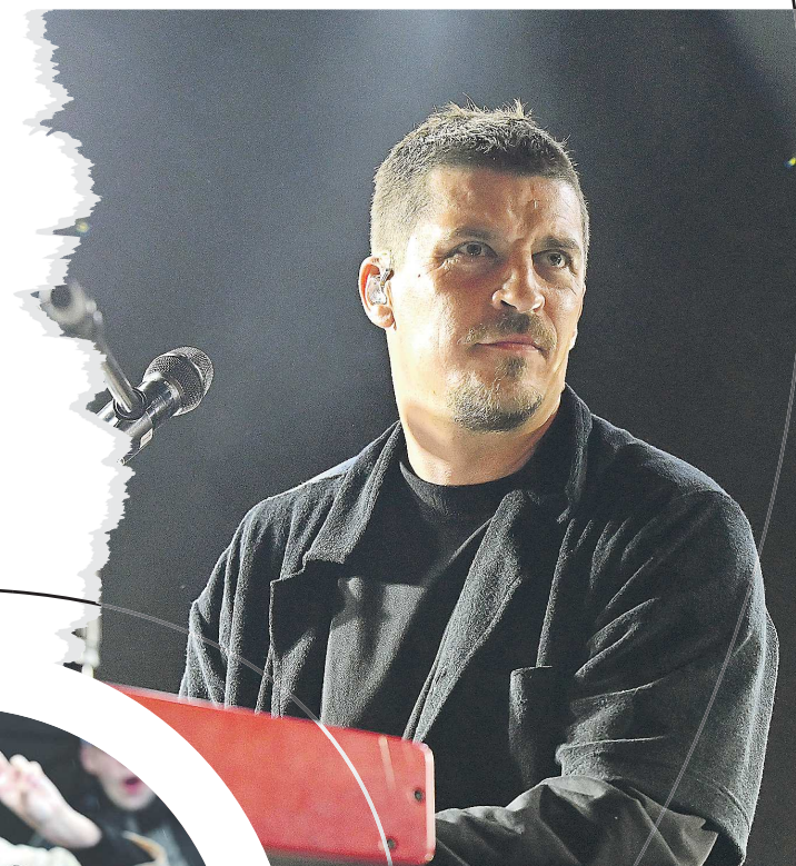
Выступление Антона Беляева и его группы Therr Maitz стало кульминацией фестиваля