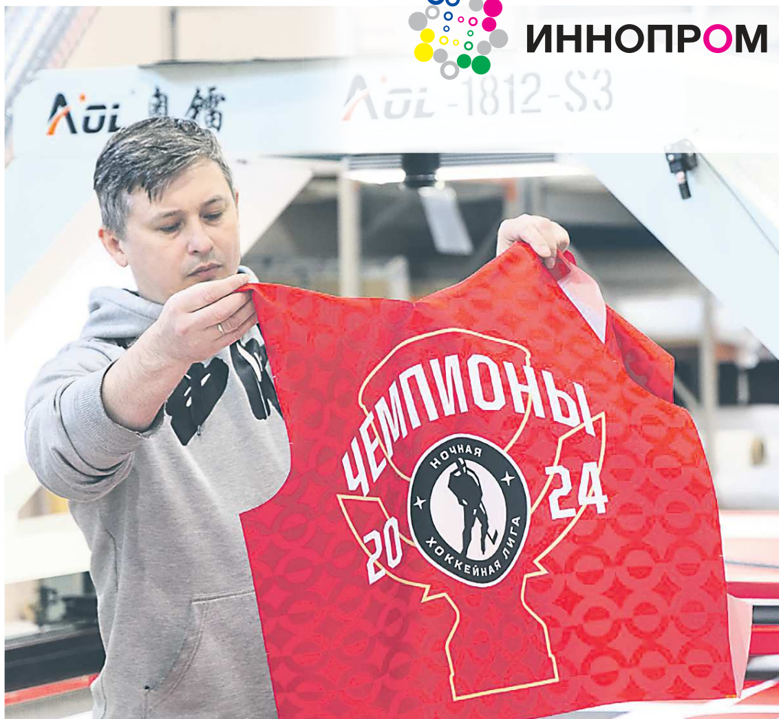
Одна из компаний, которая представит свою продукцию на стенде, – «Интекс», производитель спортивной формы, имеющий лицензию КХЛ

На выставке также пройдет Всероссийский форум «Обеспечение технологического суверенитета в производстве спортивного оборудования и инвентаря».