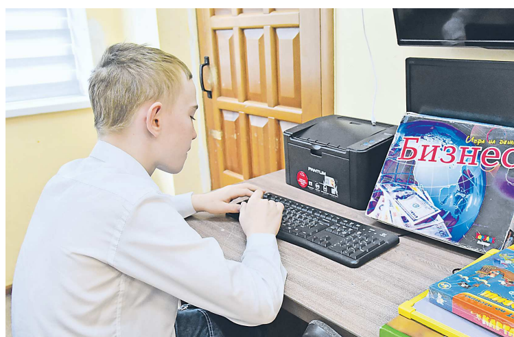
«Отрада» прекрасно оснащена компьютерной техникой и развивающими играми