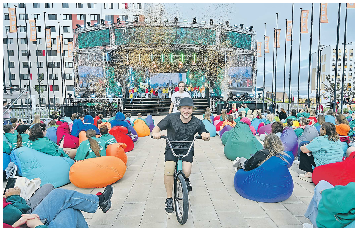
Презентацию завершили беймиксеры, которые проехали между рядами кресел-мешков перед сценой

ется с концерта, который состоит из нескольких действий. Каждое действие, в котором есть и танцы, и песни, и элементы театрального искусства, представляет один из периодов истории Свердловской области. В антрактах ведущие поясняют, какой именно период предстоит увидеть зрителям.