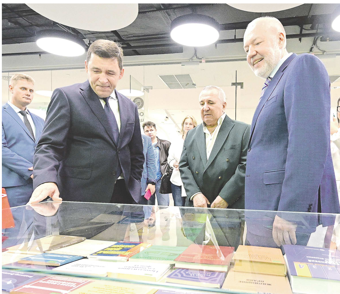
Губернатор Евгений Куйвашев высоко оценил вклад Павла Крашенинникова в развитие правовой и политической системы России

– Павел Владимирович написал больше сотни книг, на его публикации воспитано не одно поколение юристов. Безусловно, сегодня в своем статусе он продолжает свою научную деятельность, продолжает трудиться в одном из самых главных комитетов Государственной думы – комитете по государственному строительству и законодательству. В качестве депутата Павел Владимирович делает огромное количество добрых дел, и мы эти изменения в нашем регионе видим. Вся его деятельность направлена на улучшение жизни в нашей стране и, конечно же, Свердловской области, – сказал глава Среднего Урала.