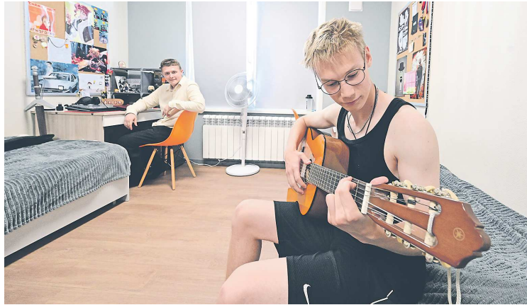
В пяти корпусах общежития 806 жилых комнат, оборудованных всем необходимым для комфорта студентов