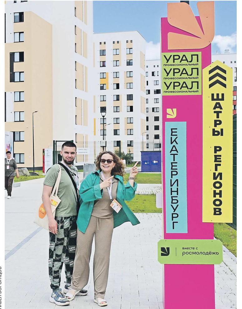
Не заблудиться в кампусе участникам форума помогает удобная навигация

– Кампус УрФУ – это нечто не реальное. На самом деле, мне кажется, это мечта каждого студента – здесь жить и учиться. Для меня как жителя небольшого горо-