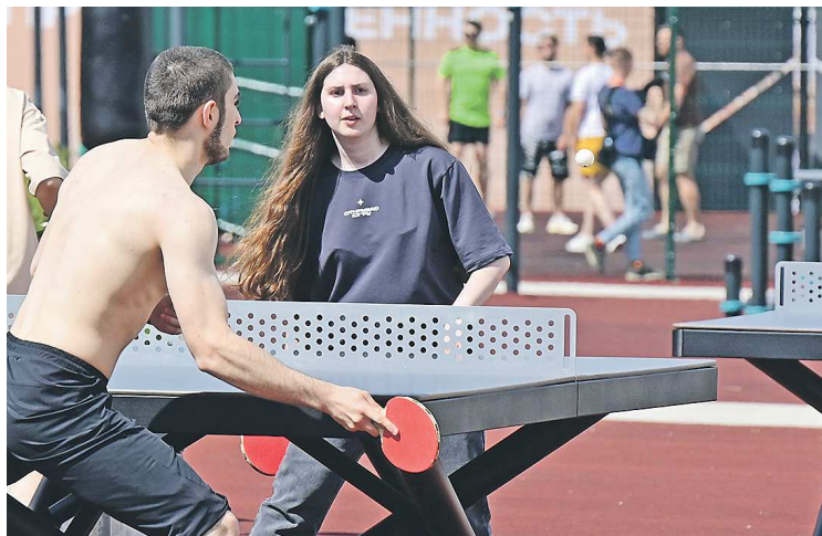
Участники форума «УТРО» также успели оценить спортивные площадки кампуса УрФУ

– У нас большая кухня, порядка трех этажей, наши сотрудники могут готовить огромный на-