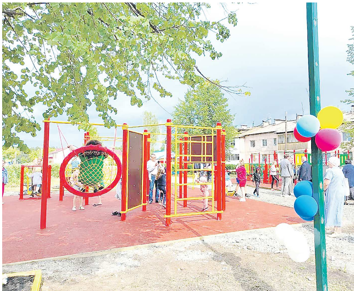
Строительство детских площадок в муниципалитете ведется не первый год, в прошлом году такой объект был открыт в поселке Сосновый Бор

ПРЕСС-СЛУЖБА АДМИНИСТРАЦИИ АРТЕМОВСКОГО ГО