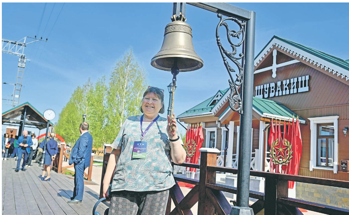
Среди запросов участников ИННОПРОМ – поездки на ретропоезде «Уральский экспресс» по маршруту Екатеринбург – Шувакиш – Верхняя Пышма

Для посетителей выставки и жителей города пять ведущих ресторанов предложат специальные гастрономические сет-ы. Они будут включать закуски, супы, горячие блюда и даже десерты из мяса, птицы, рыбы, овощей и грибов. Специальные уральские сет-ы будут доступ-