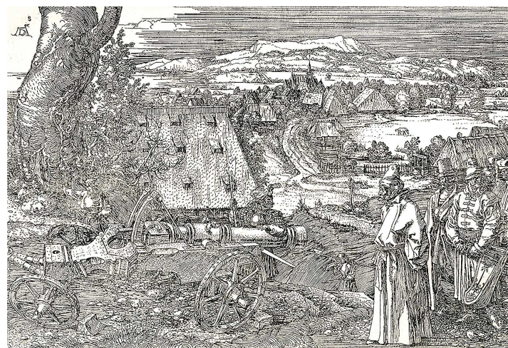
«Пейзаж с пушкой», 1518 год. Альбрехт Дюрер

Одиночные листы продемонстрируют разнообразие тем и жанров, с которыми работал Дюрер. Ранняя гравюра «Покаяние святого Иоанна Златоуста» предлагает авторский вариант иконографии популярного в XV веке сюжета. Аллегорические листы «Малая Фортуна» и «Четыре ведьмы» демонстрируют опыты художника в изображении обнаженной натуры. Ряд изображений Мадонн позволяет проследить эволюцию его стиля, соединяющего итальянизирующую манеру исполнения фигур с традиционным для северного искусства решением пространства. Наконец, на второй части выставки можно увидеть листы, выполненные в редких для Альбрехта Дюрера техниках сухой иглы и офорта.