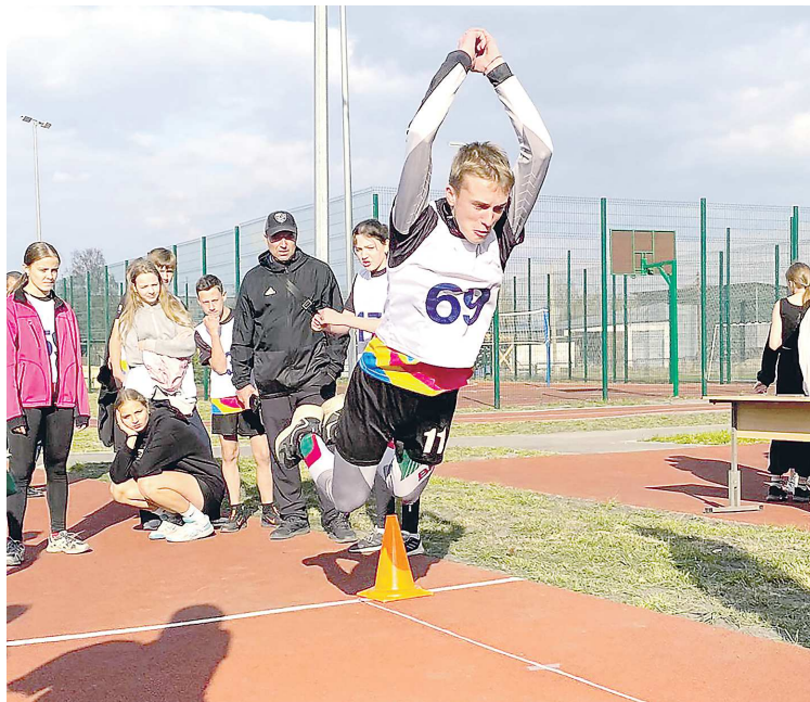
Спортивную инфраструктуру в Тавде обновляют системно. В 2022 году новый стадион был построен на территории школы №1

– Школа №7 является самой крупной по численности обучающихся в городе, здесь учится более 600 детей, поэтому очень важно провести эти работы. Также при подготовке проекта учи-