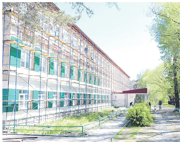
В рамках работ по капремонту талицкой школы №55 уже приступили к установке монтажных конструкций на фасаде

В Талице капитально ремонтируют школу, построенную в конце шестидесятых