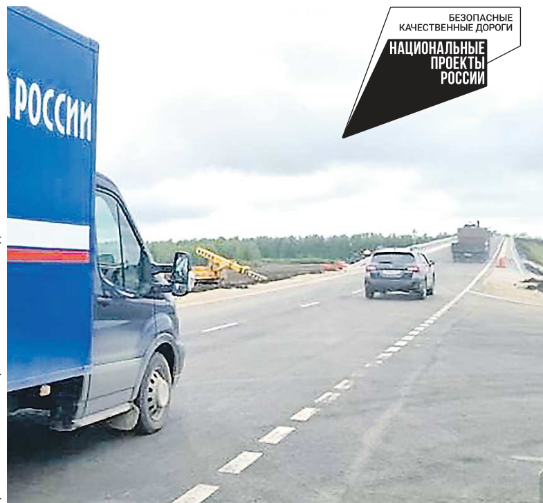
Запуск движения по новому путепроводу состоялся, на объекте осталось демонтировать часть старой дороги

Новый путепровод позволит решить эту проблему – сооружение отвечает современным требованиям и рассчита-