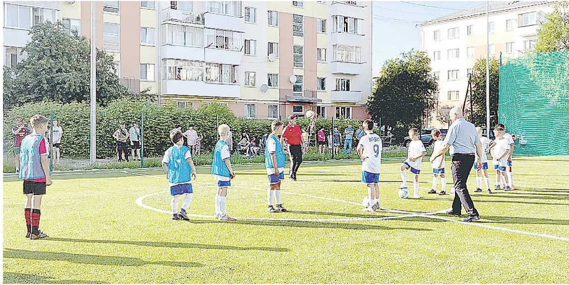
Открытие новой спортивной площадки прошло в середине июня

Площадкой смогут пользоваться не только ребята из ближайших домов, но и юные футболисты города – воспи-