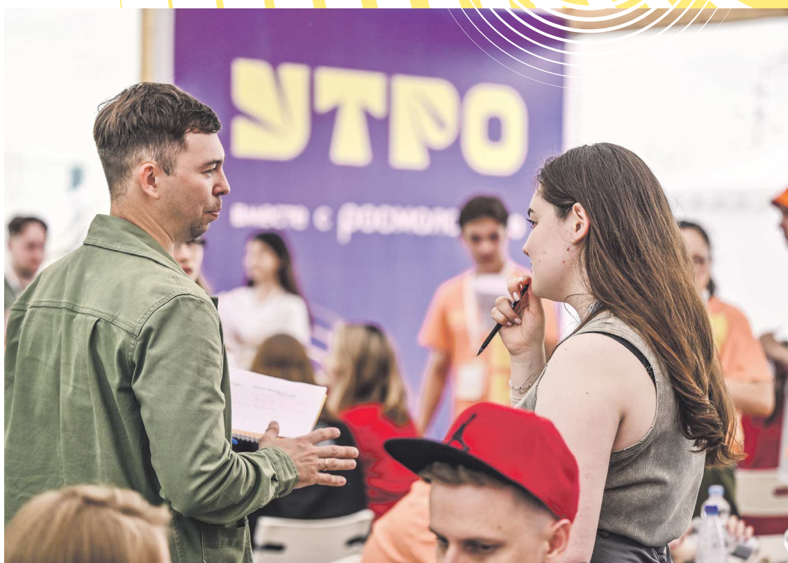
Форум позволяет не только получить новые знания, но и завести друзей и обменяться контактами