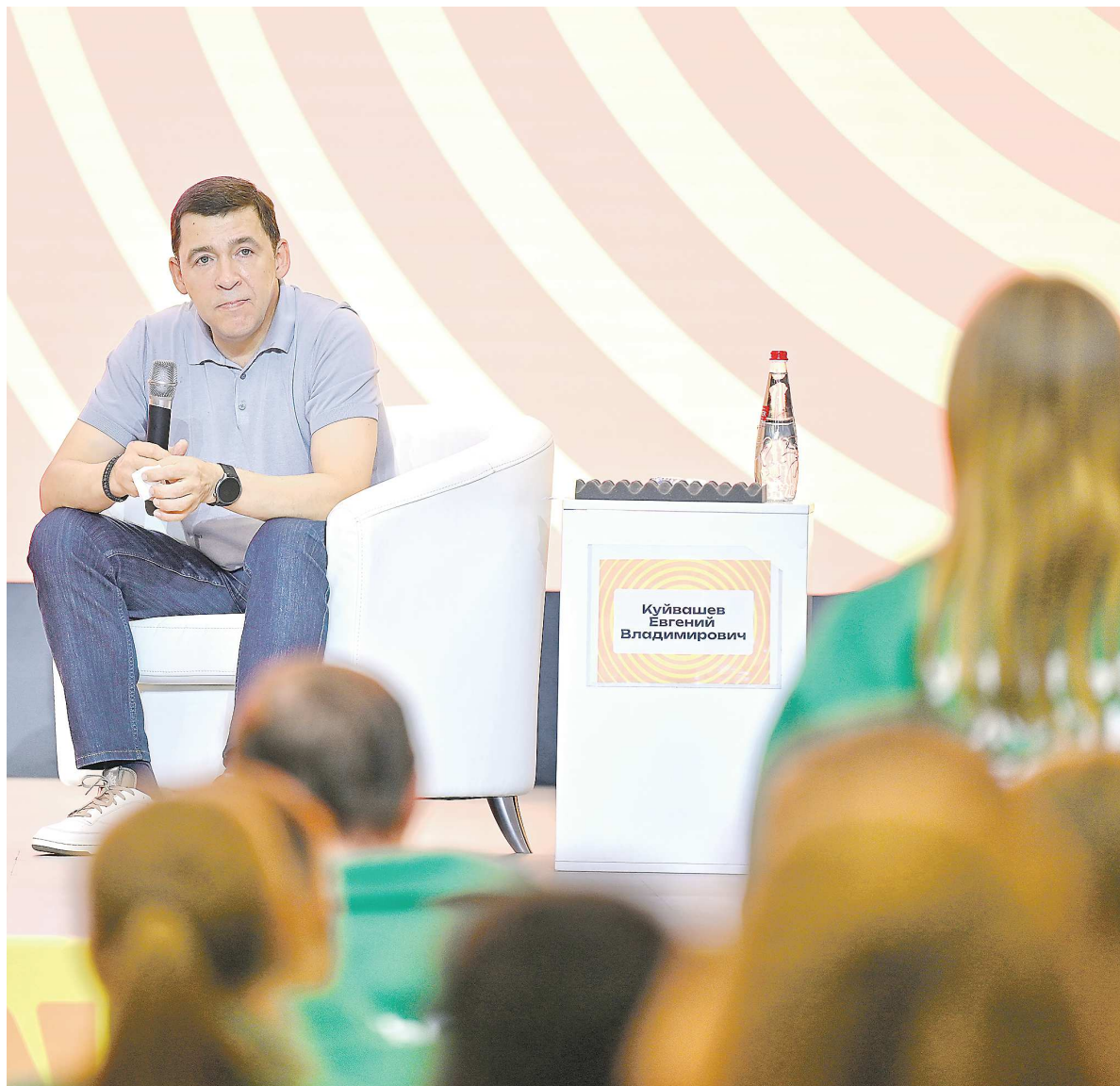
В первый день форума губернатор Евгений Куйвашев обсудил с его участниками кадровый и научный потенциал Свердловской области