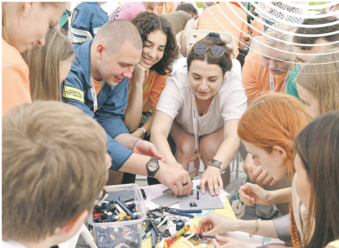
Визуализировать свои идеи можно даже при помощи конструктора LEGO, как убедились участники форума в шатре Свердловской области