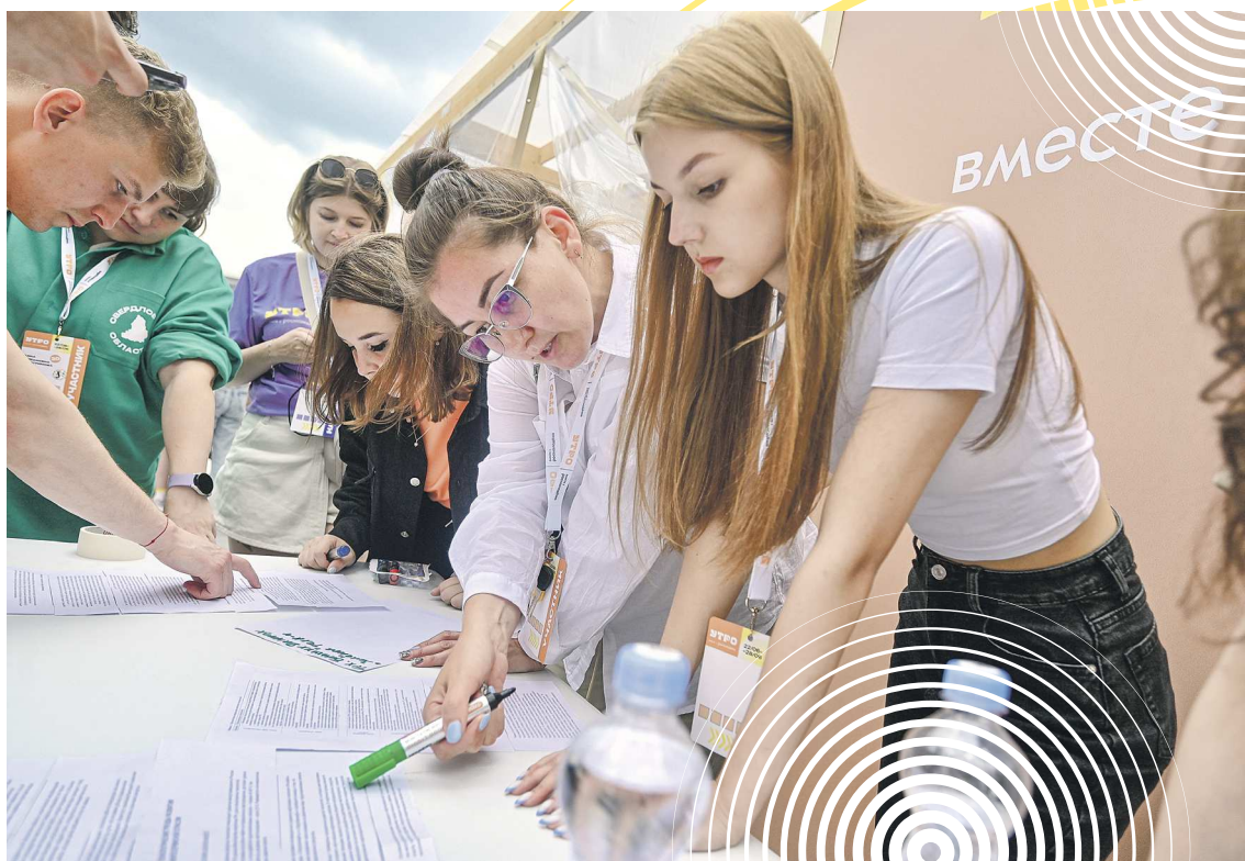
О трендах нефтяной промышленности в шатре Югры можно было узнать в формате интерактивной командной игры