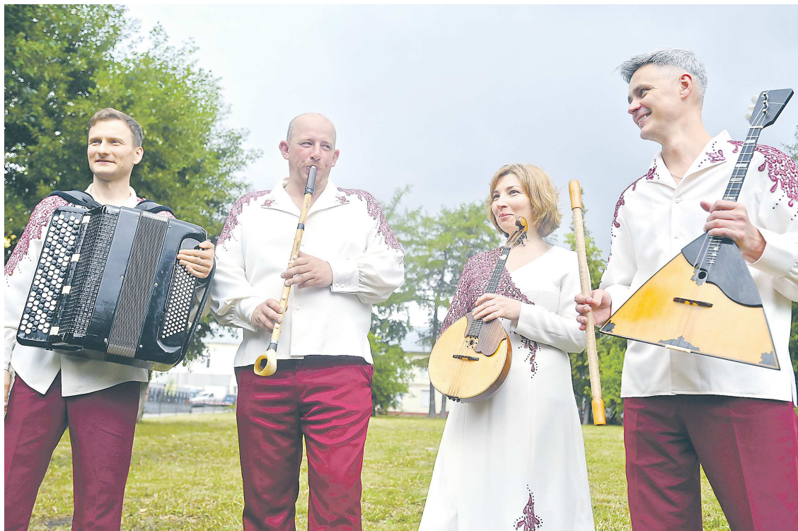
Одни из самых ярких участников «Безумных дней» – ансамбль «Аюшка»

Уникальные мелодии прозвучат на аутентичных народных инструментах: в течение одного концерта солисты «Аюшки» сыграют на 15 – 20 из них. Это жалейки, гусли, бубны, варганы, этнические флейты, трещотки, колокольчики, гармошки и другие. С несколькими инструментами нас познакомили подробнее.