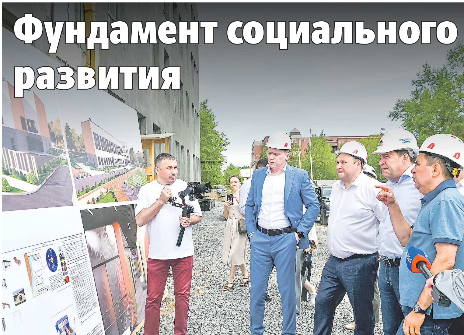
Строительная готовность четырехэтажного здания школы №2 сейчас оценивается в 60 процентов