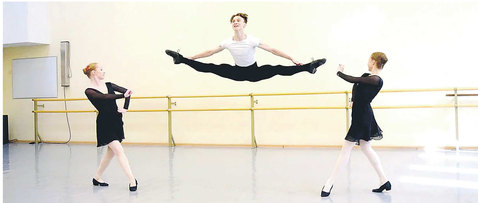
Даже в учебных классах воспитанники колледжа демонстрируют высочайшее мастерство и выразительную характерность в танце

Да и судьба первого выпуска Уральского хореографического колледжа подтверждает этот постулат. Не поверите – большинство выпускников получили по два-три приглашения в разные труппы России.