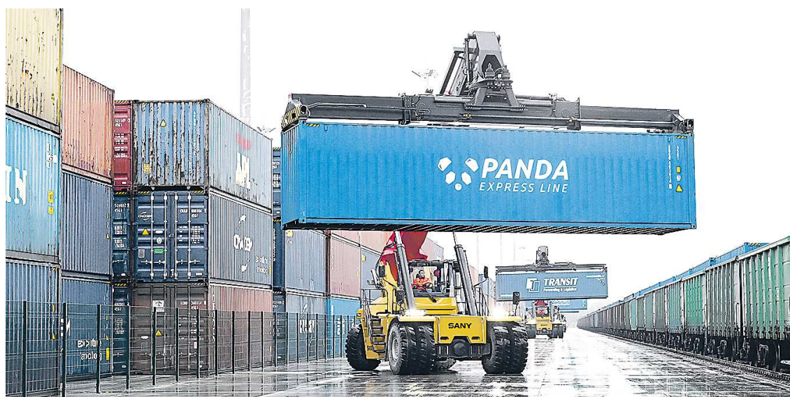
Мегапроект «Сухой порт» является важным звеном в решении задачи, поставленной Президентом России Владимиром Путиным, о расширении транспортного коридора, связывающего страну с Ближним Востоком и Азией