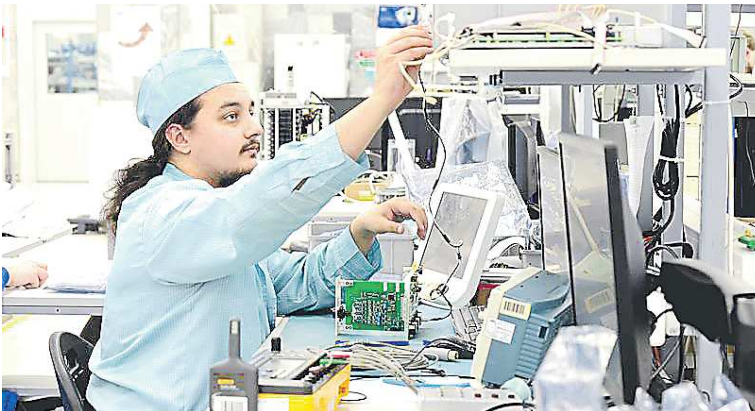
Уральский оптико-механический завод им. Э.С. Яламова и Екатеринбургский политехникум подписали соглашение о создании нового направления подготовки молодых специалистов для оптико-электронной отрасли

От вас, уважаемые депутаты, был вопрос о концессиях. Сегодня в регионе реализуется 46 концессионных соглашений с объемом инвестиций порядка 60 миллиардов рублей. За несколько лет создано и реконструировано более 96 объектов инфраструктуры, построено и модернизировано более 40 километров инженерных сетей.