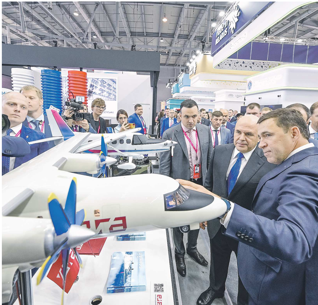
На выставке ИННОПРОМ-2023 глава Правительства РФ Михаил Мишустин отметил, что свердловские предприятия вносят значимый вклад в развитие собственных производств в стране

Полный текст доклада губернатора читайте на стр. II-V →