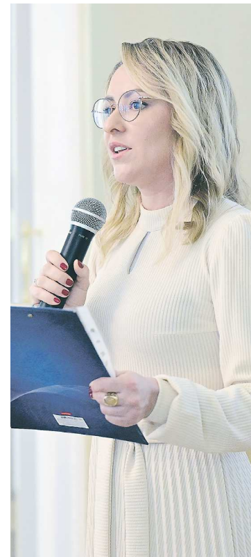
Художник Татьяна Пинчук на открытии выставки в МИКЮИ