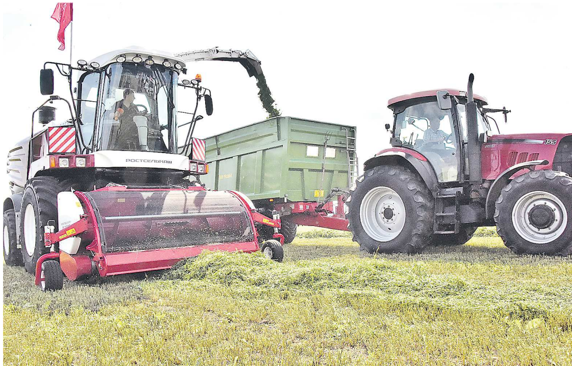
По решению Евгения Куйвашева с 2024 года размер подъемных выплат для молодых специалистов сельскохозяйственных предприятий составил от 200 до 300 тысяч рублей

Безусловно, рост экономики и качества жизни людей