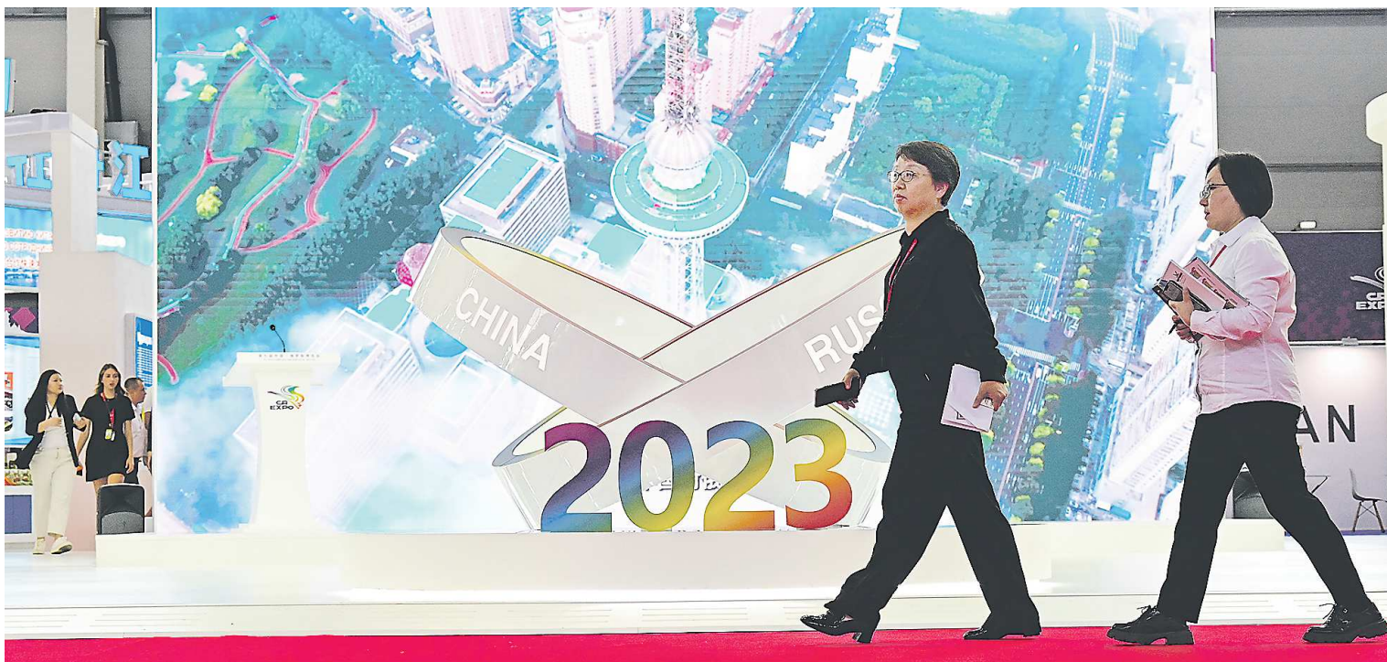
ИННОПРОМ-2023 стал площадкой для еще одного масштабного мероприятия — Седьмого Российско-Китайского ЭКСПО. Выставка занимала 10 тысяч квадратных метров, где были представлены более 370 компаний из Китая

Мы прорабатываем возможности заключения новых концессий. Интерес к такому формату есть у Ирбита, Камышлова, Талицы, Староуткинской, Сосьвы, Асбеста, Невьянска и многих других муниципалитетов.