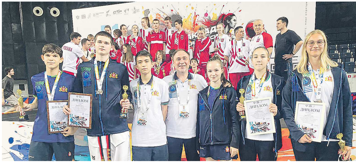
Свердловские тхэквондисты с наградами Спартакиады учащихся