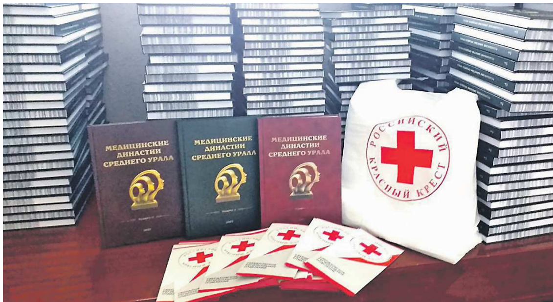
Главный партнер проекта «Медицинские династии Среднего Урала» – Свердловское региональное отделение Российского Красного Креста