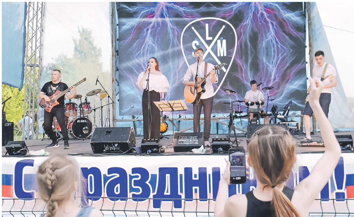
Для жителей Лесного выступили творческие коллективы города, а также группы «Кафе Le Karzan» и «СоЛяМи»

В Среднеуральске прошел областной фестиваль, посвященный победе на Чудском озере. Го-