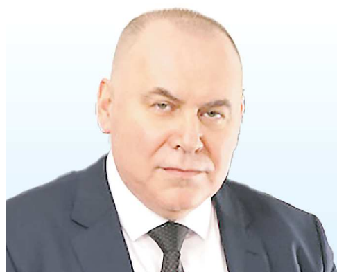
Андрей КАРЛОВ, министр здравоохранения Свердловской области

“ Свердловская область богата медицинскими династиями. История каждой фамилии уникальна и неповторима, каждая прошла свой путь образования и становления, но в одном они похожи – из поколения в поколение передаются в них ценности, неподвластные времени: гуманизм, милосердие, сострадание.