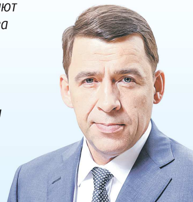
Евгений КУЙВАШЕВ, губернатор Свердловской области

« Органы местного самоуправления играют важнейшую роль в повышении качества жизни граждан. На местах решаются самые актуальные для людей вопросы: тепло и безопасность в домах, чистота и порядок на улицах, качество дорог и работа транспорта, доступность школ и больниц.