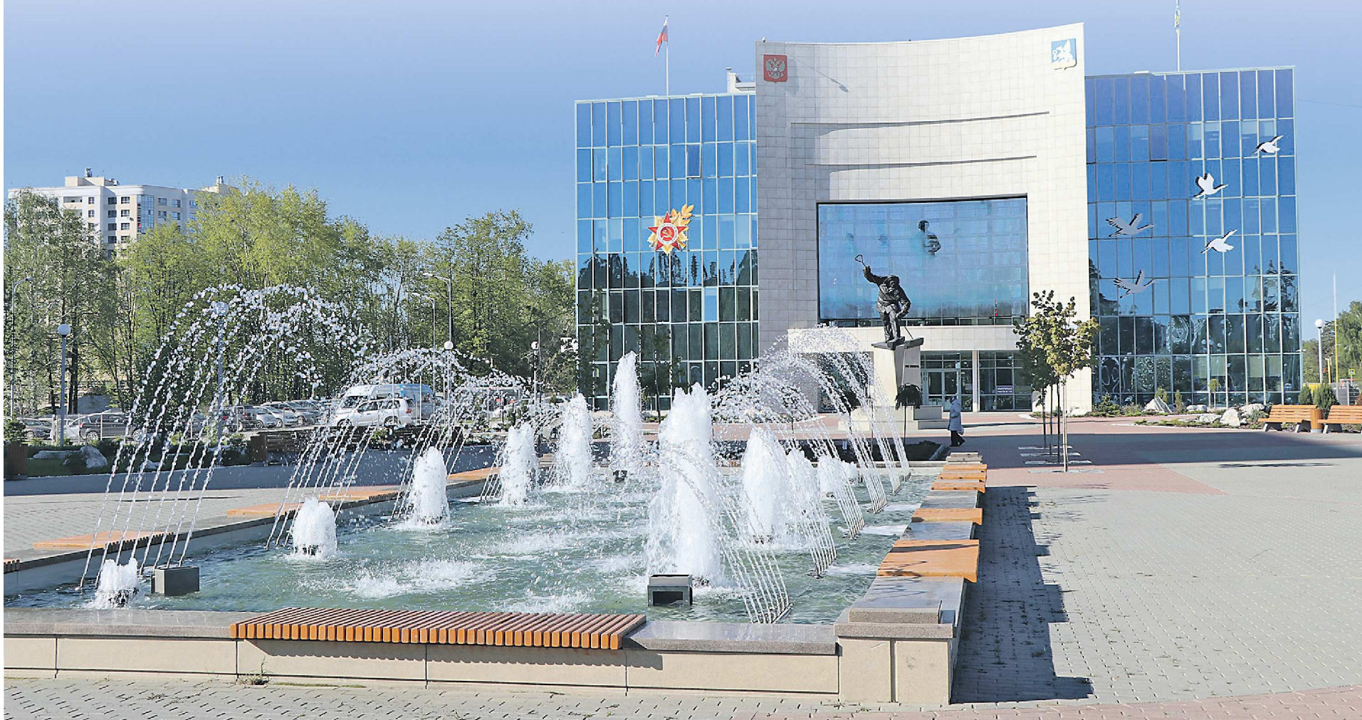
ПРЕСС-СЛУЖБА АДМИНИСТРАЦИИ ГОРОДСКОГО ОКРУГА ВЕРХНЯЯ ПЫШМА

« В современной России на органы местного самоуправления возложена важная, ответственная миссия. От их эффективной, слаженной работы во многом зависят совершенствование социальной инфраструктуры наших городов, благоустройство сельских территорий, решение самых востребованных, повседневных проблем людей.