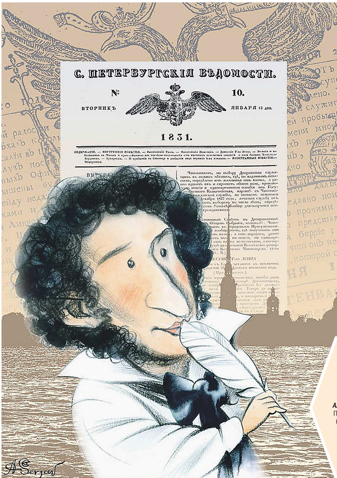
ИЛЛЮСТРАЦИЯ АЛЕКСАНДРА СЕРГЕЕВА

Одна из них – карикатура авторства Александра Сергеева – украшает главный материал тематических страниц, посвященных Пушкинскому дню.