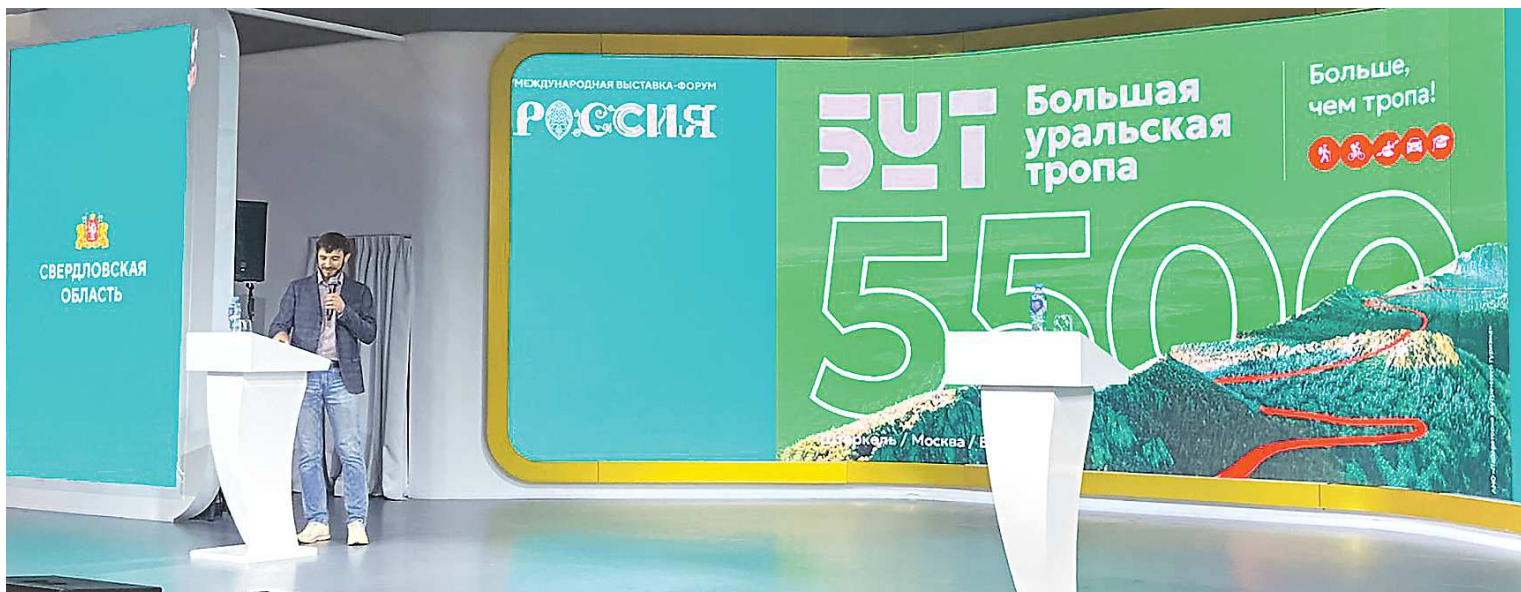
В рамках проекта «Большая уральская тропа» для туристов разработано четыре вида трек: пешеходный, водный, автомобильный и велосипедный