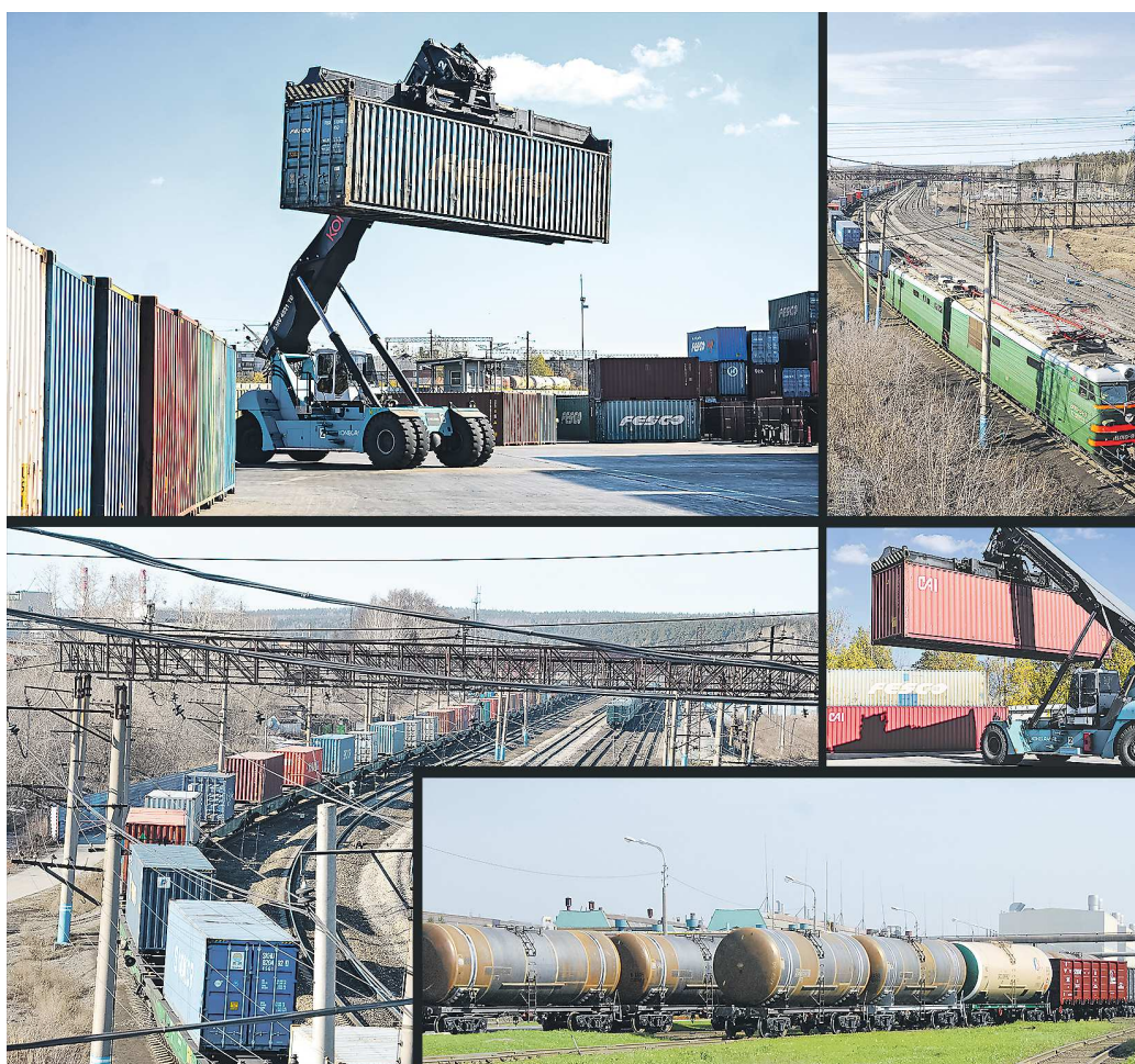
В основе флагманского проекта «Сухой порт» лежит создание мощной транспортно-логистической инфраструктуры

АЛЕКСЕЙ КУНИЦОВ / АЛЕКСАНДР ЗАЙЦЕВ / ГАЛИНА СОЛОВЬЕВА