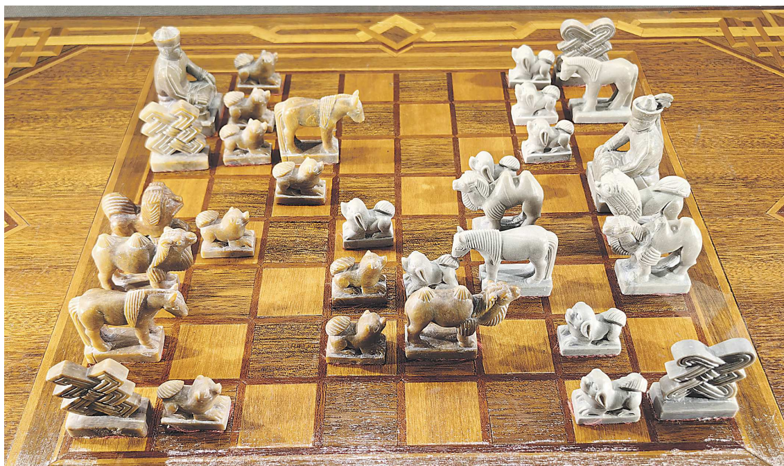
Необычные шахматы из камня – подарок Леониду Брежневу от Тувинского обкома КПСС