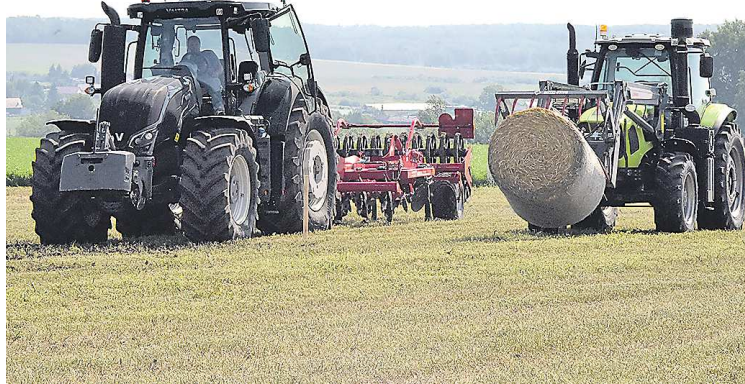
Получая господдержку, каждый молодой специалист должен отработать в сельхозорганизации не менее трех лет

На субсидию могут рассчитывать молодые люди до 35 лет, которые получили высшее или среднее профессиональное образование и работают в организациях агропромышленного комплекса или крестьянско-фермерских хозяйствах. Получая господдержку, каждый молодой специалист должен отработать в сельхозорганизации не менее трех лет.