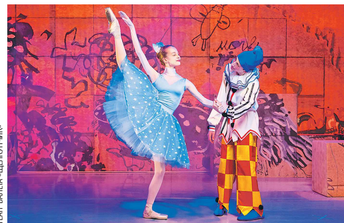
ТЕАТР БАЛЕТА «ЩЕЛКУНЧИК»