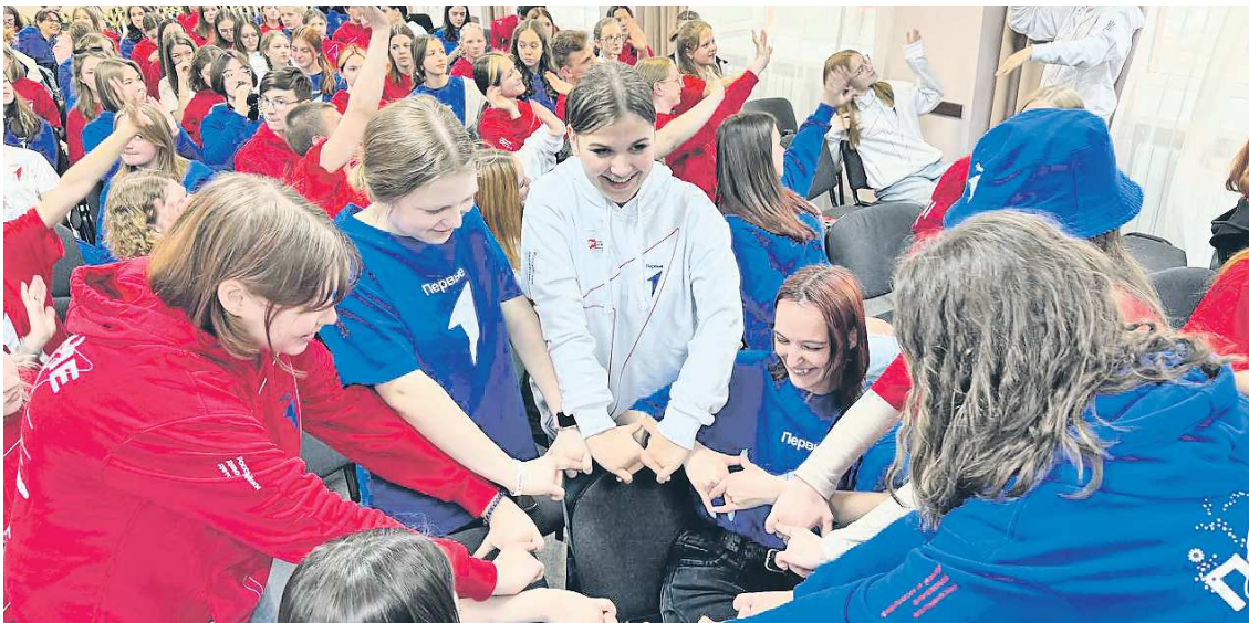
В игре познакомились и сдружились