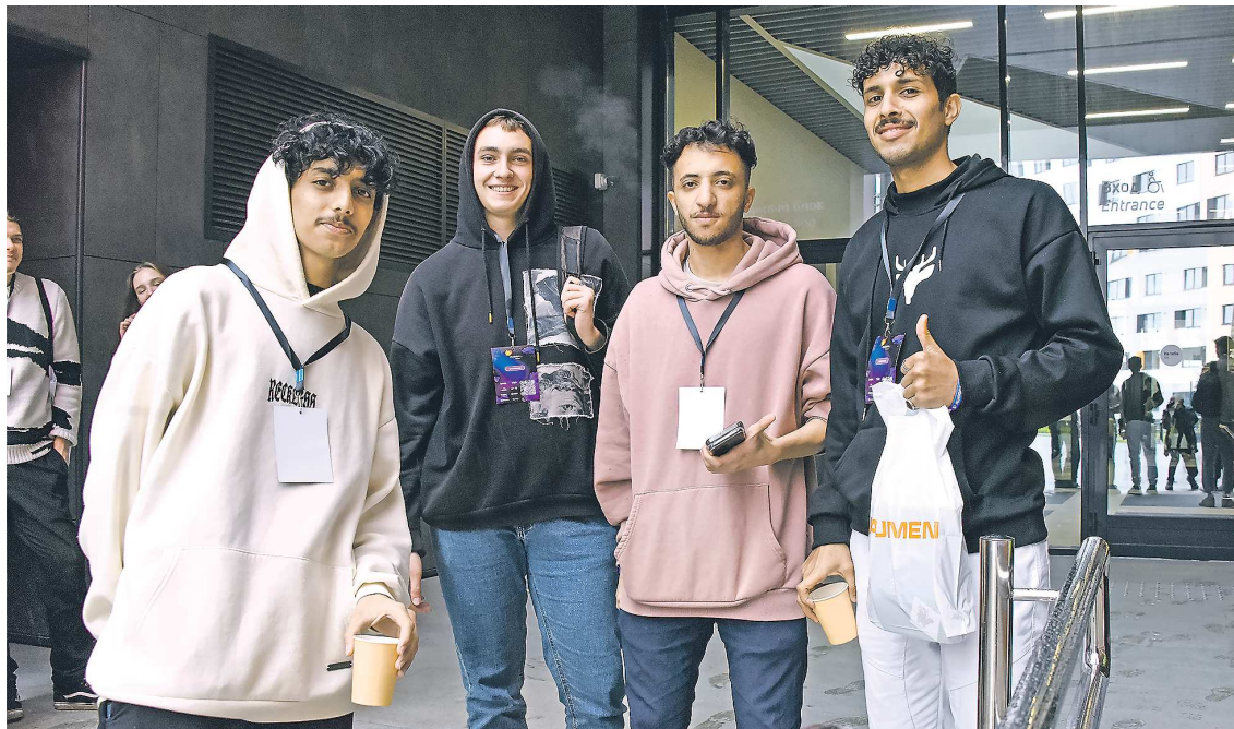
Кампус мирового уровня УрФУ уже стал альма-матер для студентов из разных стран. Теперь здесь ждут представителей Объединенных Арабских Эмиратов

Представители Уральского федерального университета уже работают с коллегами из Эмиратов. В 2023 году состоялось подписание меморандума о сотрудничестве в сфере развития адаптивной физической культуры и спорта между Высшей организацией шейха Зайеда для людей с ограниченными возможностями здоровья и УрФУ. В ближайшее