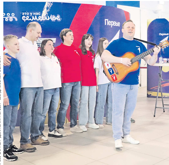
Семейное выступление прошло под бурные аплодисменты

ПРЕСС-СЛУЖБА «ДВИЖЕНИЯ ПЕРВЫХ» СВЕРДЛОВСКОЙ ОБЛАСТИ