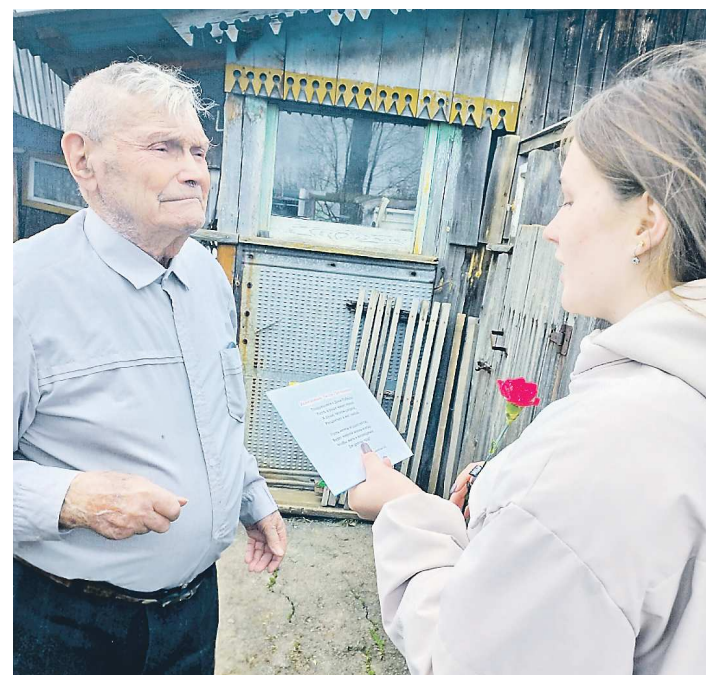
Приятно поздравить ветерана

Дарья СЛЕПЦОВА, газета «Школьная жизнь», с. Бакряж