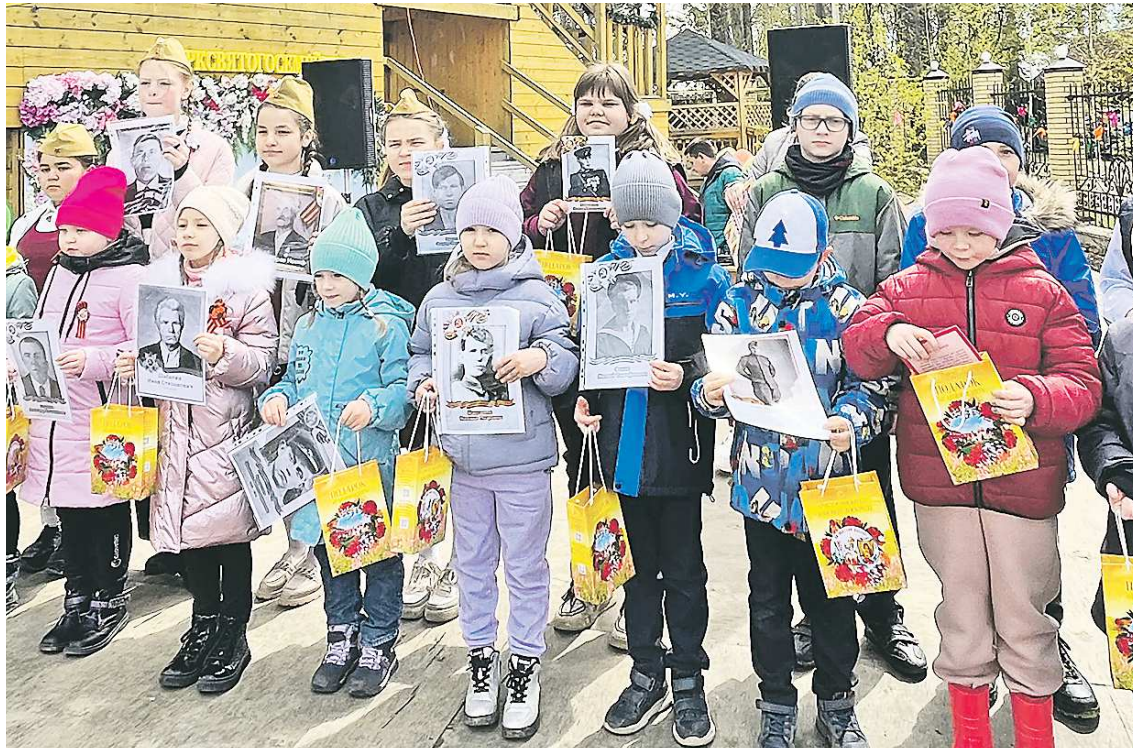
Каждый ребенок знает своего прадеда-воина