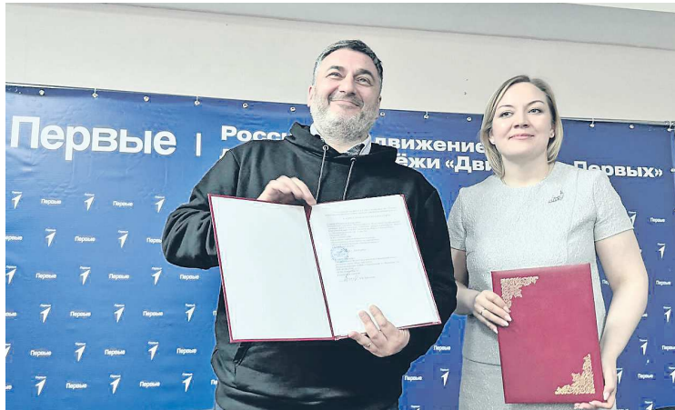
Подписали соглашение – будем сотрудничать!

ПРЕСС-СЛУЖБА «ДВИЖЕНИЯ ПЕРВЫХ» СВЕРДЛОВСКОЙ ОБЛАСТИ