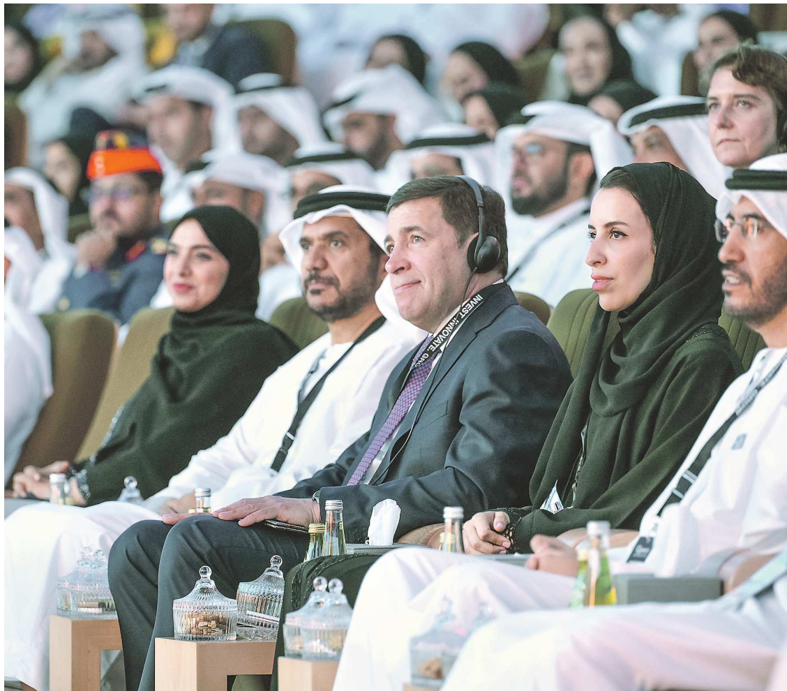
Губернатор Евгений Куйвашев 27 мая принял участие в церемонии открытия форума «Сделай это в Эмиратах» и панельной сессии, посвященной перспективам развития в промышленности