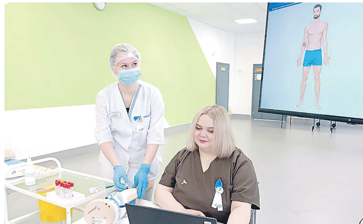
Школьники смогли своими глазами увидеть работу специалистов разного профиля в современных медучреждениях

– Профессия врача сегодня очень востребована. Всегда есть место работы, стабильный заработок и меры социальной поддержки – выплаты по госпрограммам, предоставление жилья. Медицинская наука постоянно движется вперед, и вы будете двигаться вместе с ней