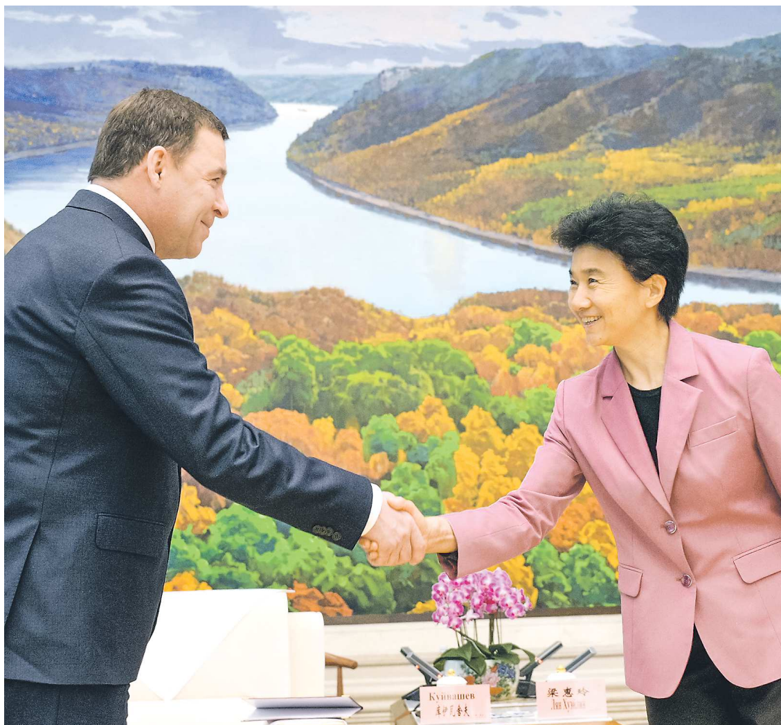
16 мая, в преддверии VIII Российско-Китайского ЭКСПО, в Харбине губернаторы Свердловской области Евгений Куйвашев и провинции Хэйлунцзян госпожа Лян Хуэйлин обсудили перспективы дальнейшего сотрудничества в промышленной, торгово-экономической, гуманитарной и других сферах

Подробнее об участии свердловской делегации в VIII Российско-Китайском ЭКСПО читайте в ближайших номерах «ОГ».