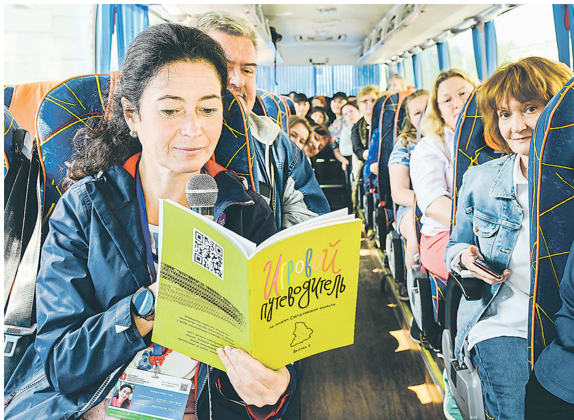
В одном из автобусных туров также будет презентована версия Игрового путеводителя по музеям региона