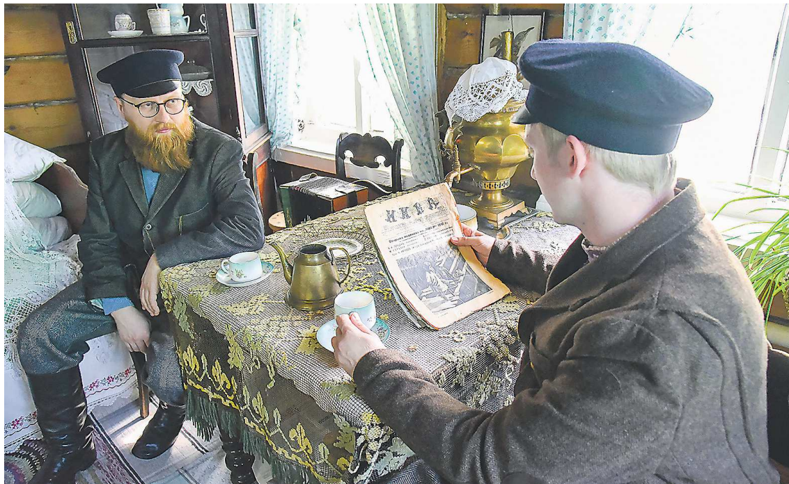
Дом-музей Паши Бажова в Сысерти приготовил для гостей насыщенную программу, которая включает авторские экскурсии и даже выступление оркестра

Семейная тема в музеях Свердловской области будет представлена максимально разнообразно. Так, в Гаринском краеведческом музее приглашают в музыкально-литературную гостиную «О семье, любви и верности», на открытие выставки «Реликвии бабушкиного сундука» и мастер-класс «Семейный оберег». В Карпинском краеведческом музее подготовлена большая программа под названием «Семейная кругосветка», куда войдут мастер-класс «Семейный герб на память», выставка «Богословская династия Воложениных » и даже эксклюзивная экскурсия от главы Карпинска Андрея Клопова «Семейная реликвия» (начало в 19:30). Также в этот день в музее состоится открытие выставки «Верность жизненной правде», посвященной 100-летию со дня рождения писателя Виктора Астафьева .