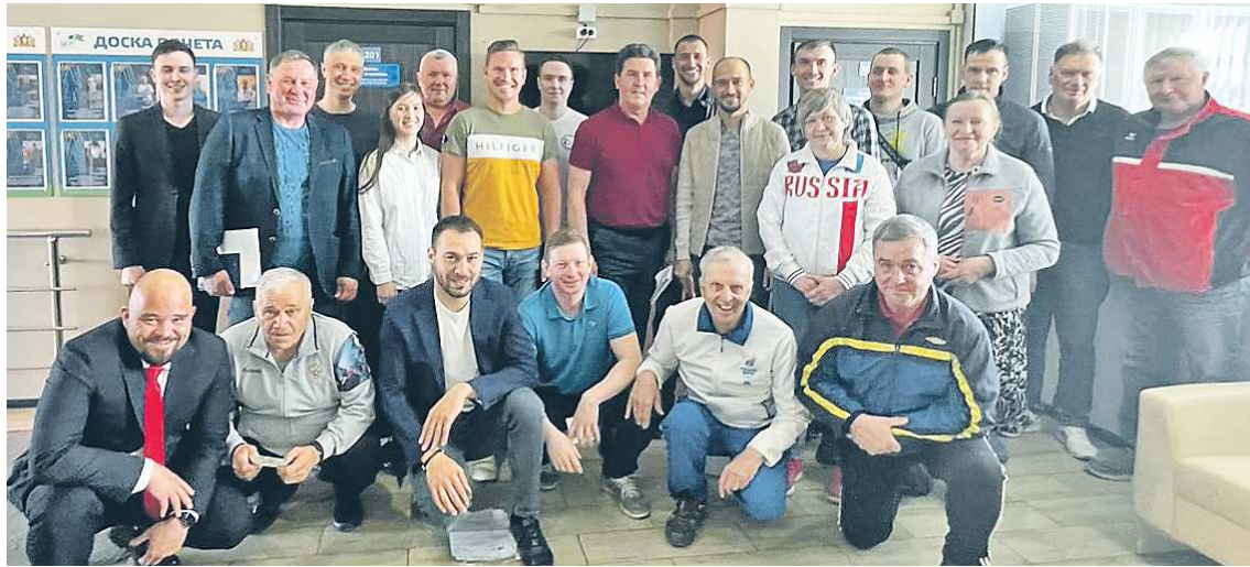
В заседании приняли участие ведущие биатлонные специалисты Свердловской области