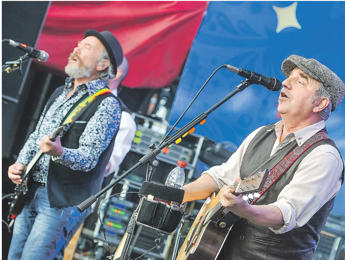
В 2024 году на звание «Достояние Среднего Урала» претендует рожденная в Свердловске всероссийско известная рок-группа «Чайф»

– Идея народного конкурса в том, чтобы сами жители области называли объекты, символы и даже смыслы, которые они для себя считают нашим достоянием. Мы ежегодно на первом этапе конкурса получаем более ста