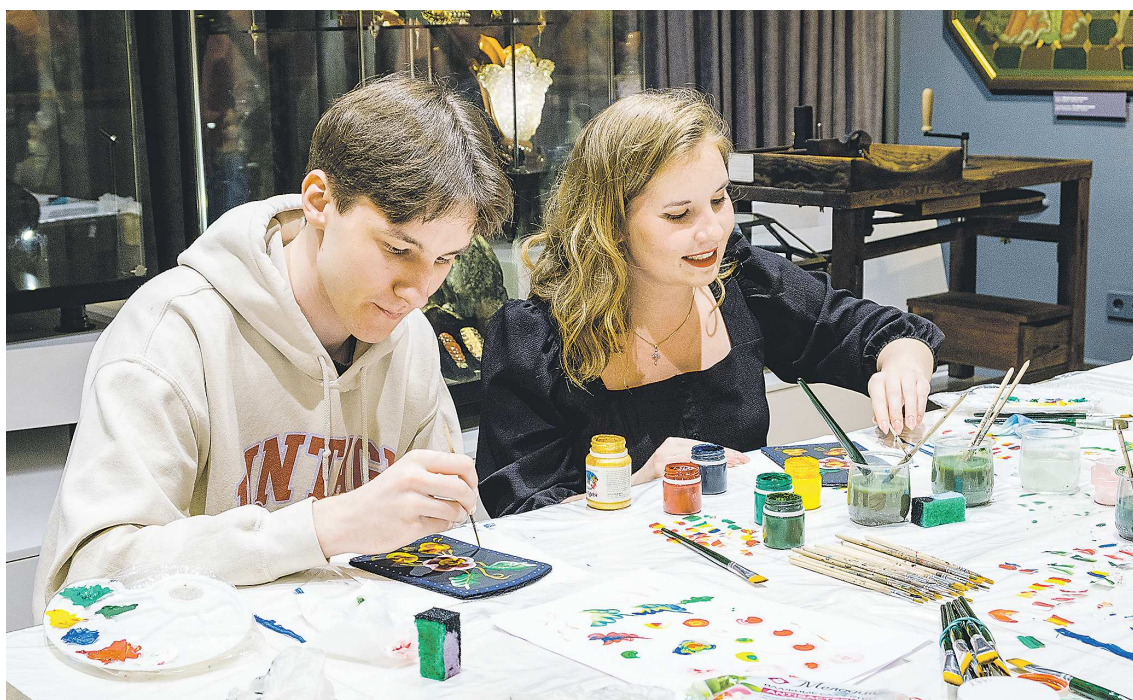
Музей истории камнерезного и ювелирного искусства в Ночь музеев предложит гостям сразу несколько мастер-классов, связанных с творчеством Павла Бажова

Посетителей исторического парка «Россия – моя история» ожидает увлекательное погружение в историю России. За один вечер можно будет узнать о формировании государственности нашей страны, истории Екатеринбурга, развитии отечественной космонавтики и многом другом. На протяжении всей Ночи будут проходить экскурсии по экспозиции «От завода к столице Урала» и новой выставке «Космос. Вначале была мечта». Кроме того, для семейной аудитории парк предложит виртуальный квиз с возможностью выиграть ценный приз.