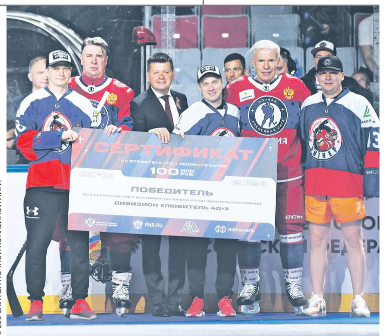
Вячеслав Фетисов вручил игрокам «Пионера-40+» главный приз Ночной хоккейной лиги