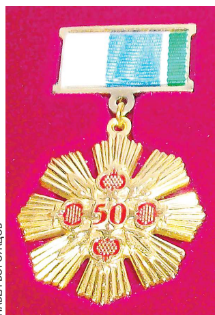
Знаком отличия Свердловской области «Совет да любовь» награждают семейные пары, прожившие в браке не менее 50 лет