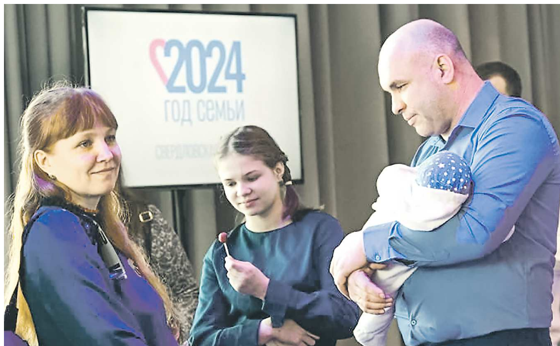
Новыми мерами поддержки смогут воспользоваться около 69 тысяч семей Свердловской области

В частности, теперь семьям будут компенсироваться 30% расходов на оплату не только коммунальных услуг, но и наём или содержание жилого помещения, а также взноса на капитальный ремонт общего имущества в многоквартирном доме. Бесплатным питанием будут обеспечиваться не только школьники, но и учащиеся средних специальных учебных заведений. Выплата на покупку школьной формы увеличится с 4 до 6 тысяч рублей, получить ее смогут семьи, чей доход на одного человека не