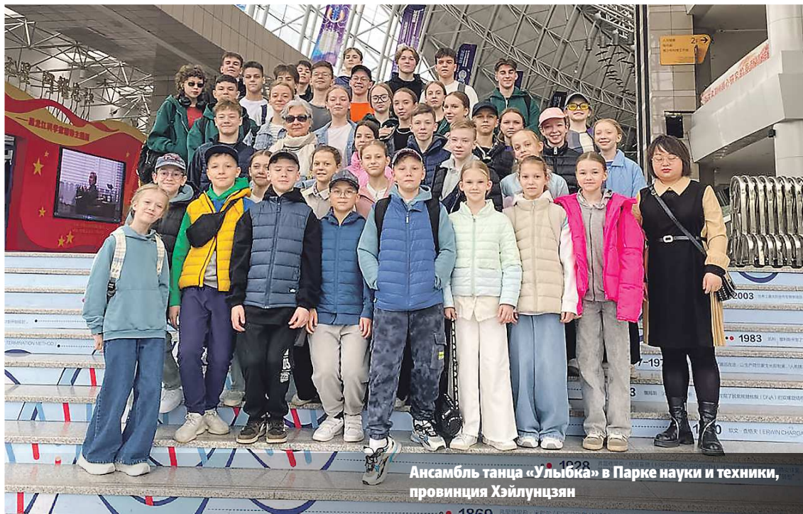
Ансамбль танца «Улыбка» в Парке науки и техники, провинция Хэйлунцзян

Напомним, VIII Российско-Китайское ЭКСПО пройдет с 17 по 21 мая в китайском городе Харбине. Организаторами ЭКСПО выступают Министерство промышленности и торгов-