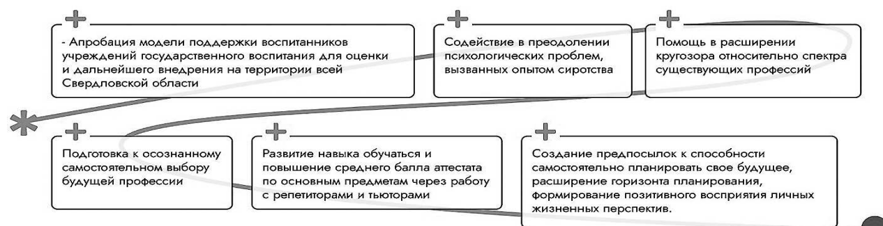
Рис. 4. Проект «Новые горизонты»