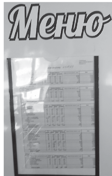
Фото 9. СОШ № 10, г. Реж