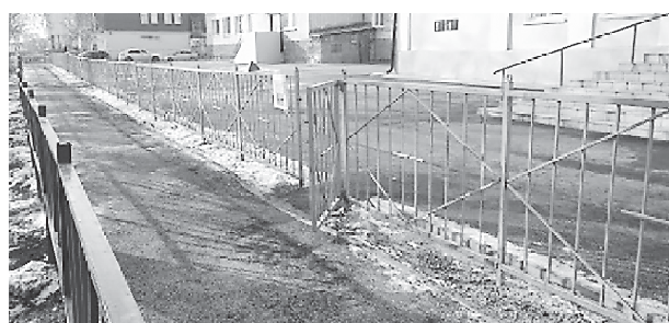
Фото 6, 7, 8. МБОУ «Средняя общеобразовательная школа № 3», г. Реж

В части наиболее часто фиксируемых иных нарушений антитеррористической защищённости необходимо отметить следующие: