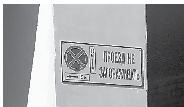
Фото 4-5. МАОУ «Средняя школа № 1 имени И.И. Марьяна», г. Красноуфимск