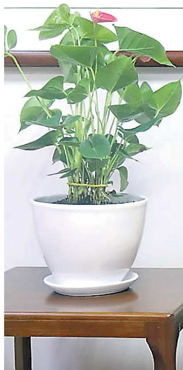
ГЕНЕРАЛЬНОЕ КОНСУЛЬСТВО КНР В Г. ЕКАТЕРИНБУРГЕ / Р