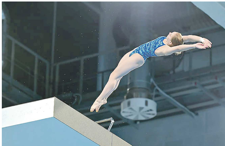
Одним из самых зрелищных видов спорта Игр дружбы станут прыжки в воду. Соревнования пройдут в Екатеринбурге

«В целях обеспечения гарантированного свободного доступа российских спортсменов и спортивных организаций к международной спортивной деятельности, развития новых форматов международного спортивного сотрудничества постановляю провести международные соревнования «Всемирные игры дружбы» в 2024 году в городе Москве и городе Екатеринбурге», говорится в Указе.