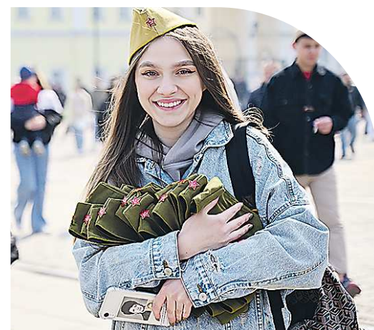
В этом году акция «Бессмертный полк» прошла в новом формате. Молодежь часто размещала портреты родственников на мобильный телефон