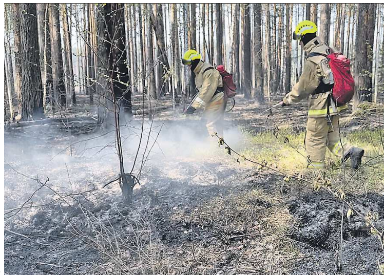
Дополнительные ранцевые огнетушители оперативно доставлены в муниципалитеты по распоряжению губернатора

« Работа ведется. Мобилизован значительный объем сил и средств, большую помощь спасателям оказывают волонтеры. Прошу Минтранс совместно с профильными министерствами проработать вопрос привлечения специализированной техники, которая может быть использована в болотистой и другой труднопроходимой местности. Министерство общественной безопасности прошу проанализировать работу административных комиссий, глав муниципалитетов на предмет профилактики захламленности территорий сельхозпроизводителей, частных и домостроений. От нашей с вами профилактической работы зависит пожарная обстановка в целом в области.