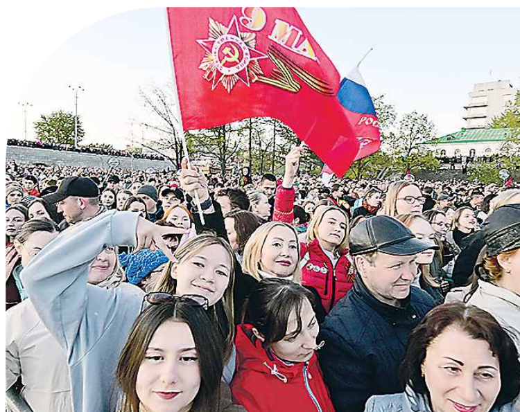
Праздничные мероприятия в Екатеринбурге собрали более 150 тысяч человек