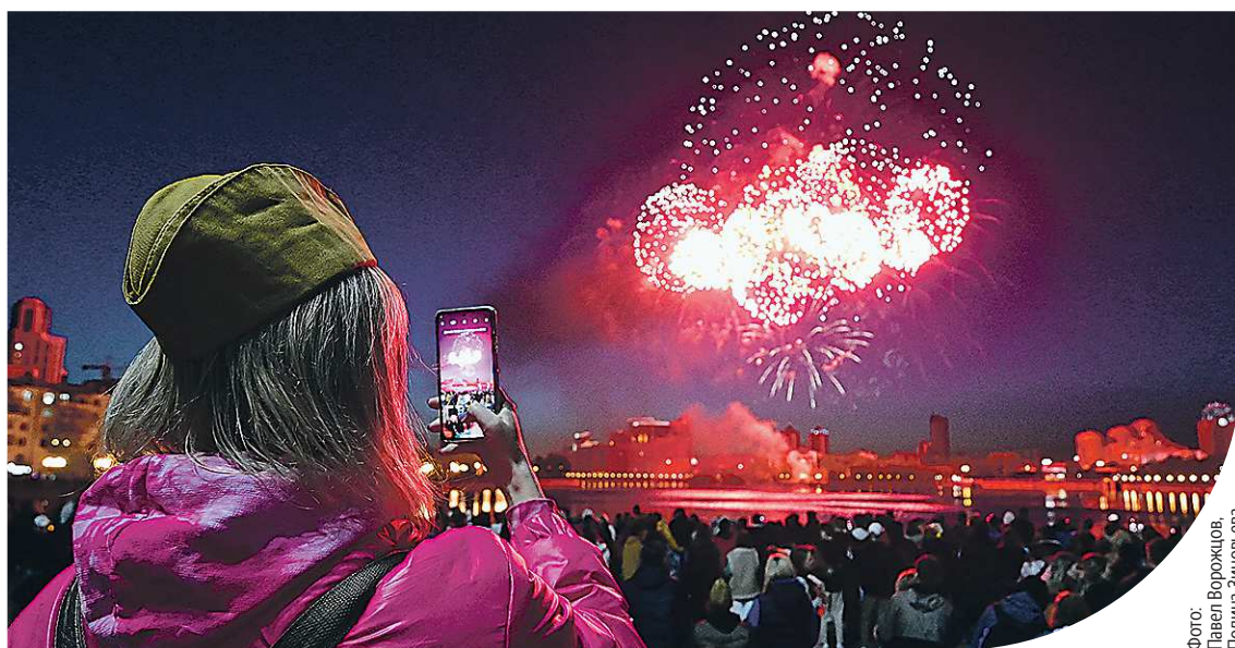
В этом году праздничный фейерверк запустили с одной точки – с акватории Городского пруда. Салют продолжался порядка 10 минут