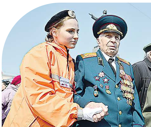
Воспитанники юнармии и отряда «Каравелла» провожают ветеранов на почетные места