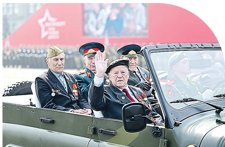
Ветераны Великой Отечественной войны делают почетный круг по площади на ретротехнике