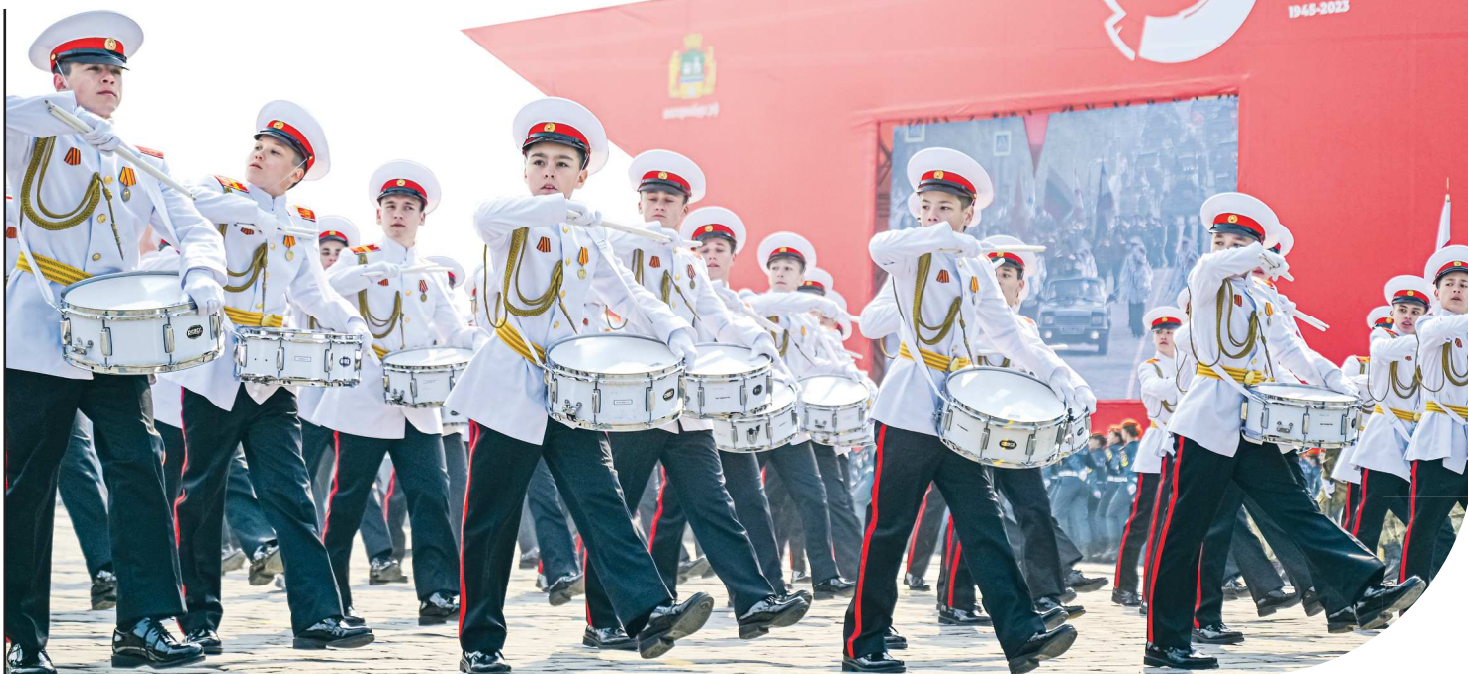
Торжественное шествие войск на Параде Победы открыла рота барабанщиков Екатеринбургского суворовского военного училища

В столице Урала 9 мая широко отметили 78-ю годовщину Великой Победы. В честь этой даты на площади 1905 года торжественным маршем прошли подразделения войск Центрального военного округа (ЦВО), силовых структур, военных учебных заведений, патриотических движений. С приветственными поздравительными словами выступили губернатор Свердловской области Евгений Куйвашев и исполняющий обязанности командующего войсками ЦВО генерал-майор Рустам Миннекаев . Главными гостями торжеств в честь Дня Победы стали ветераны и труженики тыла Великой Отечественной войны. На протяжении всего дня на нескольких площадках Екатеринбурга шли праздничные программы, а вечером с акватории Городского пруда под песни военных лет был запущен салют.