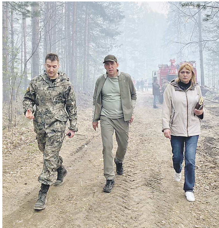
В лесу под Асбестом Евгений Куйвашев пообщался с волонтерами и местными сотрудниками МЧС

11:00 Евгений Куйвашев дает ряд поручений региональному правительству и главам муниципалитетов (подробнее см. на стр. 1. – Прим. «ОГ»). В большинстве территорий области устранена угроза распространения огня на населенные пункты. Многие крупные возгорания локализованы, ведутся работы по их окончательной ликвидации. Их ход продолжает лично контролировать глава региона.