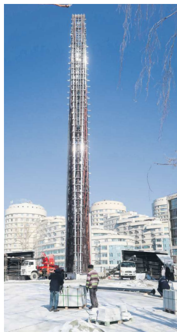
Стелу «Город трудовой доблести» откроют в Екатеринбурге в июне 2023 года