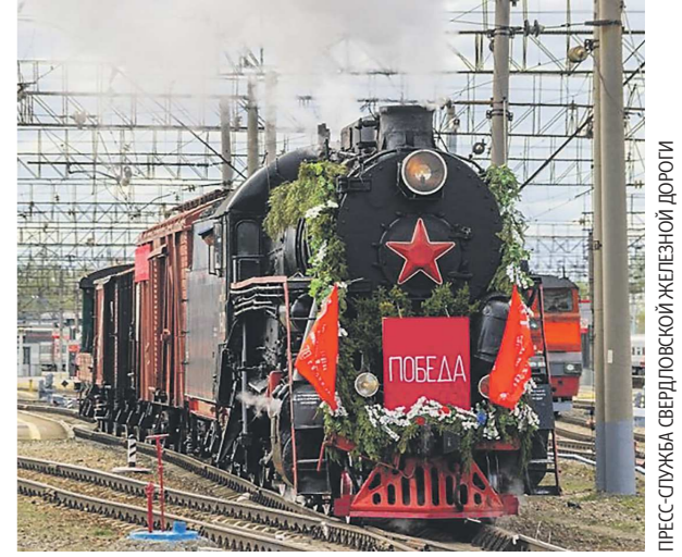
Во главе «Эшелонов Победы» будут раритетные паровозы ЛВ-123, ЛВ-355, Л-1111

По железнодорожной магистрали через Пермский край, Свердловскую и Тюменскую области, ХМАО-Югру и ЯНАО пройдут два ретропоезда на паровой тяге – «Эшелоны Победы». Об этом сообщает пресс-служба Свердловской железной дороги.