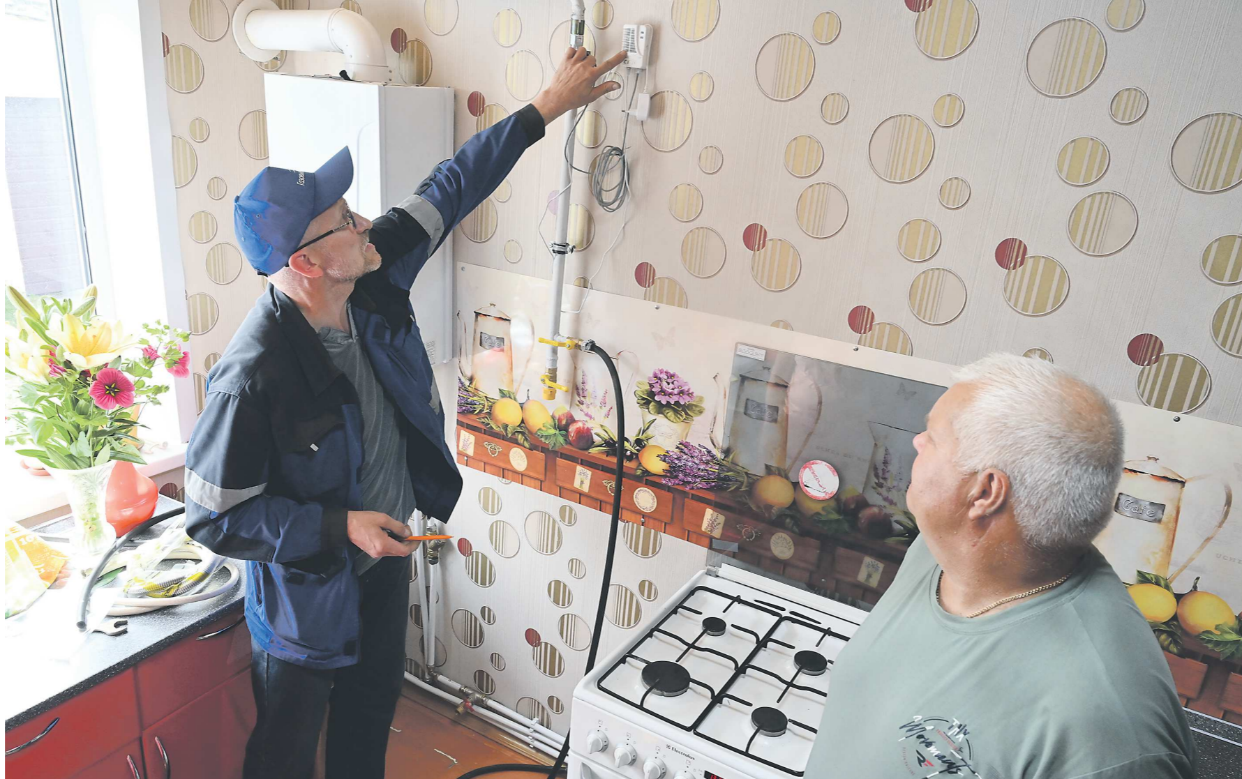
Всего на территории Свердловской области работают шесть газоснабжающих организаций, им и доверяют обслуживание и ремонт оборудования в жилых домах

На сегодня в Свердловской области работает всего шесть газораспределительных компаний. Это ГАЗЭК, «Екатеринбурггаз», «Регионгаз-инвест», «Альфастрой», «Газовые сети» и «Газпром газораспреде-