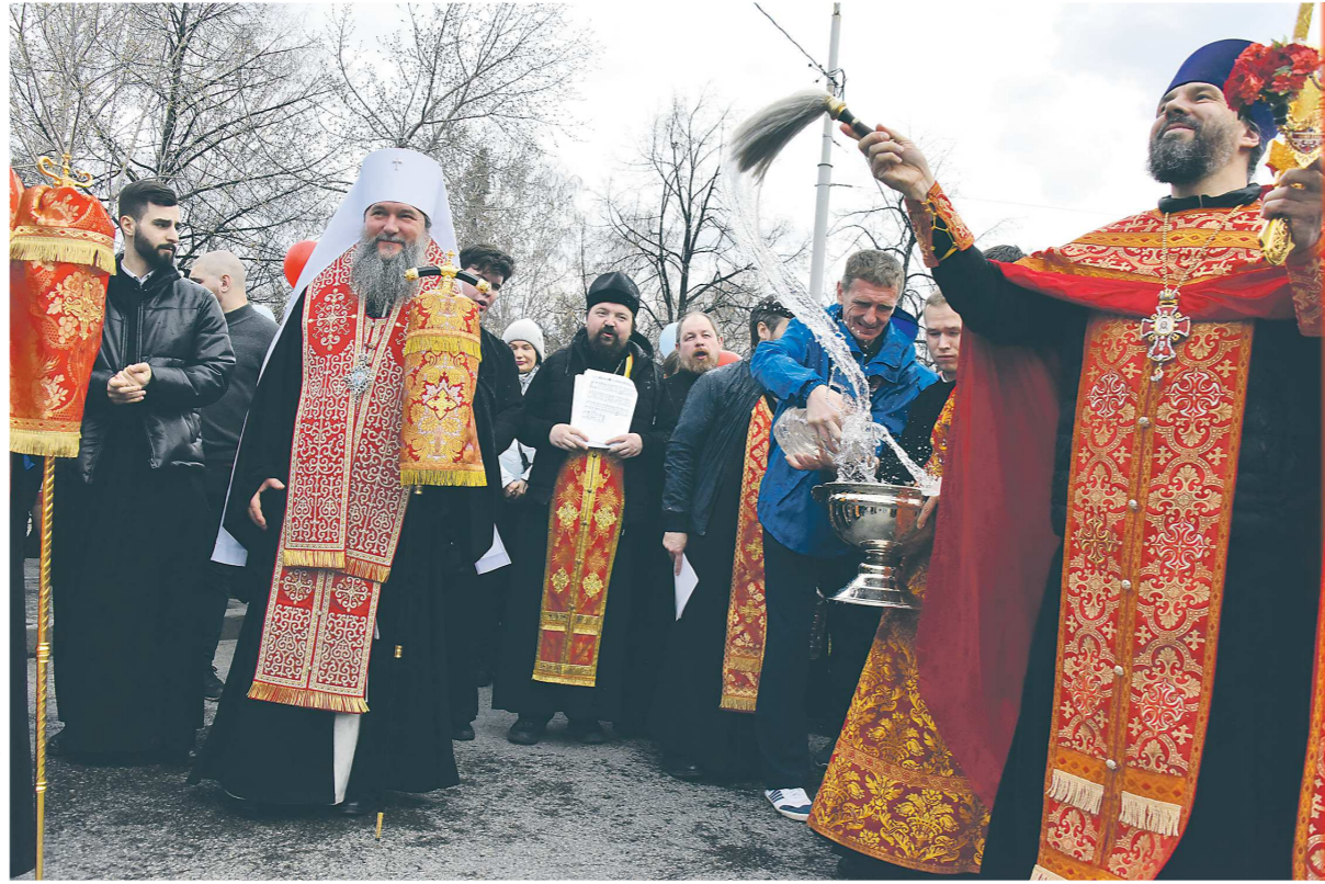
Общегородской пасхальный крестный ход традиционно пройдет в Екатеринбурге: от Свято-Троицкого кафедрального собора до Храма-на-Крови

Сегодня у православных завершается Великий Пост – время духовного очищения перед праздником Пасхи. В храме Воскресения Христова в Иерусалиме, где расположен Гроб Господень, ожидается сожжение на землю Благодатного огня. Тысячи паломников будут передавать друг другу зажженные от него свечи. Уральская делегация уже находится на Святой Земле. Ожидается, что огонь доставят в Кольцово, а затем – в Свято-Троицкий собор Екатеринбурга, где пройдет главная пасхальная служба. Ее возглавит митрополит Екатеринбургский и Верхотурский Евгений. Торжественные богослужения начнутся 15 апреля в 23:30 в храмах всех пяти епархий Екатеринбургской митрополии – Екатеринбургской, Алапаевской, Каменской, Нижнетагильской и Серовской. Для обеспечения общественного порядка и безопасности сотрудники полиции в эти дни будут нести службу в режиме повышенной оперативной готовности. Как сообщили в отделении по связям со СМИ УМВД Екатеринбурга, перед началом богослужений в храмах и церквях пройдет обследование помещений и подворий с применением технических средств и служебных собак, а посты и маршруты нарядов полиции будут приближены к местам проведения мероприятий.