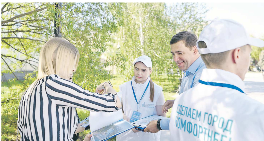
Евгений Куйвашев ежегодно принимает участие в голосовании и общается с волонтерами