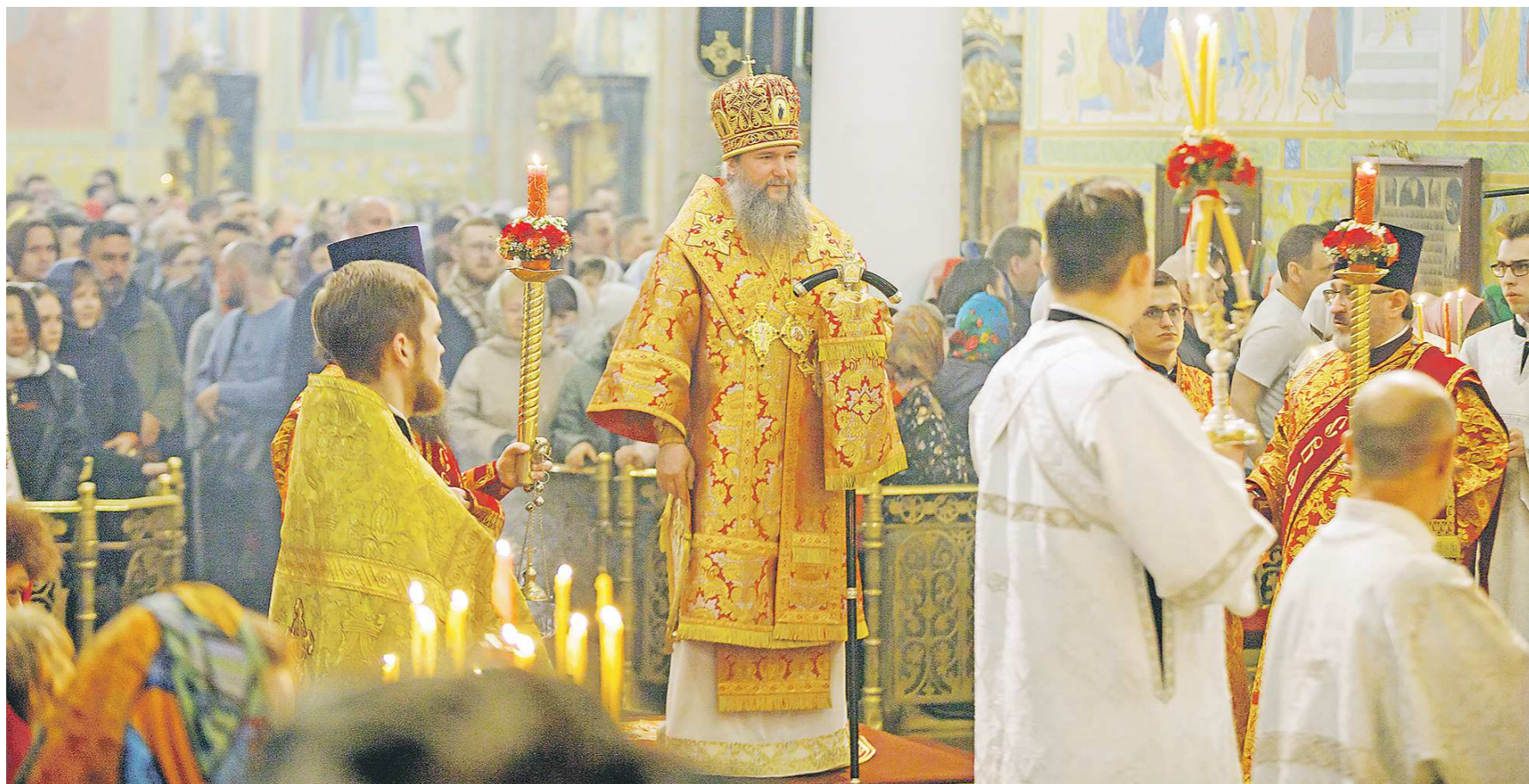
ПРЕСС-СЛУЖБА ЕКАТЕРИНБУРГСКОЙ ЕПАРХИИ

Но от воспоминаний о Воскресении мы не отрываем память Голгофы; зная о победе над грехом и смертью, не забываем о невыносимой тяжести греха и леденящем ужасе смерти, дабы забвением причин снисхождения Христова не обесценил Его искупительного подвига.