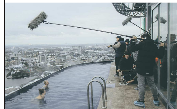
Одна из сцен фильма снималась в открытом бассейне бизнес-центра «Высоцкий»

По сюжету скромный преподаватель античной литературы Андрей по воле случая становится свидетелем ограбления банка, а затем знакомится с начальником службы безопасности Сергеем.