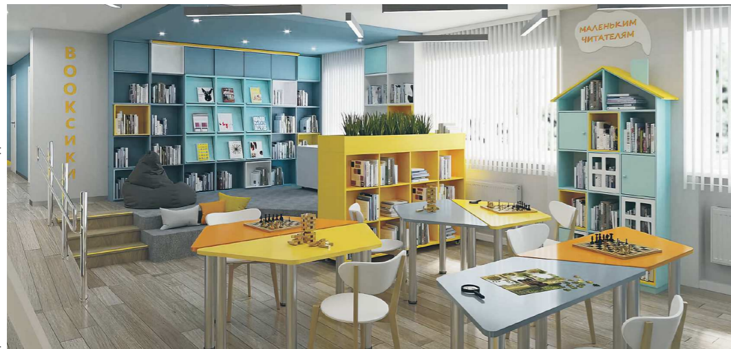
Проект новой модельной библиотеки в Дегтярске

В 2023 году в Дегтярске, Первоуральске, Верхней Салде, Косулино и поселке Энергетиков Серовского ГО будут открыты современные пространства. В рамках нацпроекта «Культура» создадут четыре модельные библиотеки, а еще одну – на средства из областного бюджета.