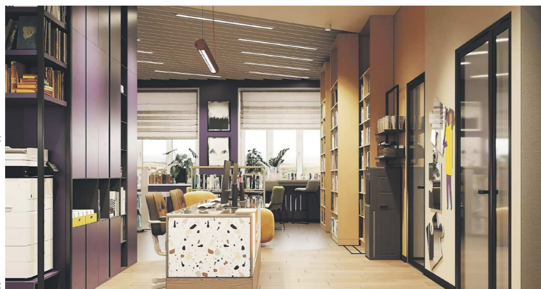
Библиотека в Косулино также будет полностью обновлена

В Свердловской области появятся новые модельные библиотеки