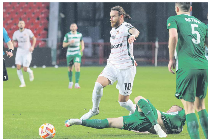
«Урал» не может забить в третьей игре чемпионата России подряд

«Ахмат» становится для «Урала» сложным соперником. В последний раз «шмели» выигрывали у футболистов из Грозного в 2019 году, с тех пор команды провели