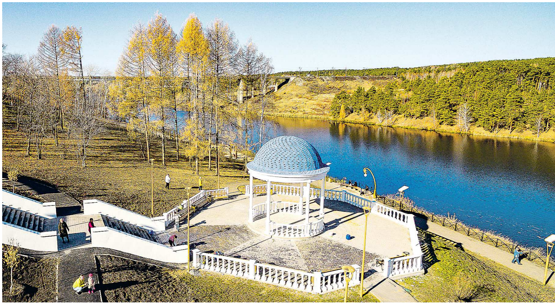
Благоустройство набережной в Каменске-Уральском идет поэтапно с 2021 года. В этом году работы планируется завершить

«Принципиально важно, когда проекты создания комфортной среды реализуются не только в крупных городах, но и в самых небольших населенных пунктах, а современная инфраструктура для отдыха и занятий спортом становится доступной для каждого уральца.»