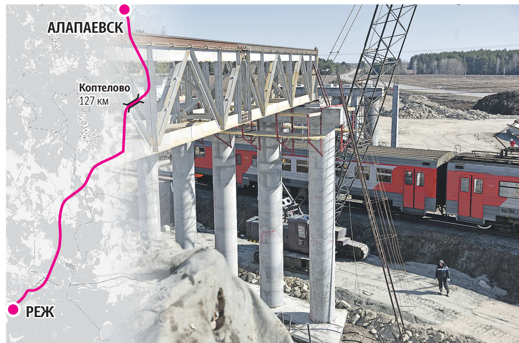
Автомобильный мост планируют достроить с опережением графика – к лету 2024 года

Необходимость строительства объекта вызвана и тем, что на данном участке железной дороги планируется строительство второго пути, а значит гарантированно увеличится время простоя на переезде. Впрочем, теперь это уже не так актуально. Совсем скоро у автомобилистов пропадет необходимость стоять перед опущенным шлаг-