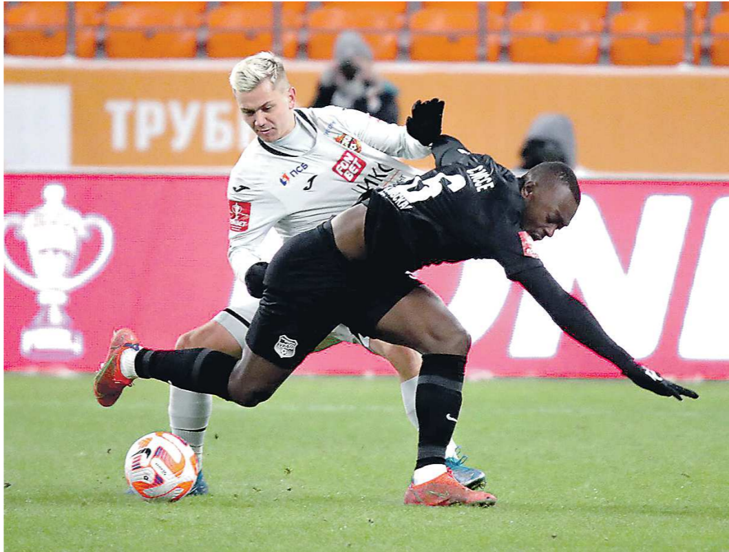
Благодаря странной формуле турнира «Урал» и ЦСКА в нынешнем розыгрыше Кубка России точно сыграют друг с другом четыре раза. Но, может быть, – и пять: если проигравшая финал «Пути РПЛ» команда выиграет потом финал «Пути регионов»