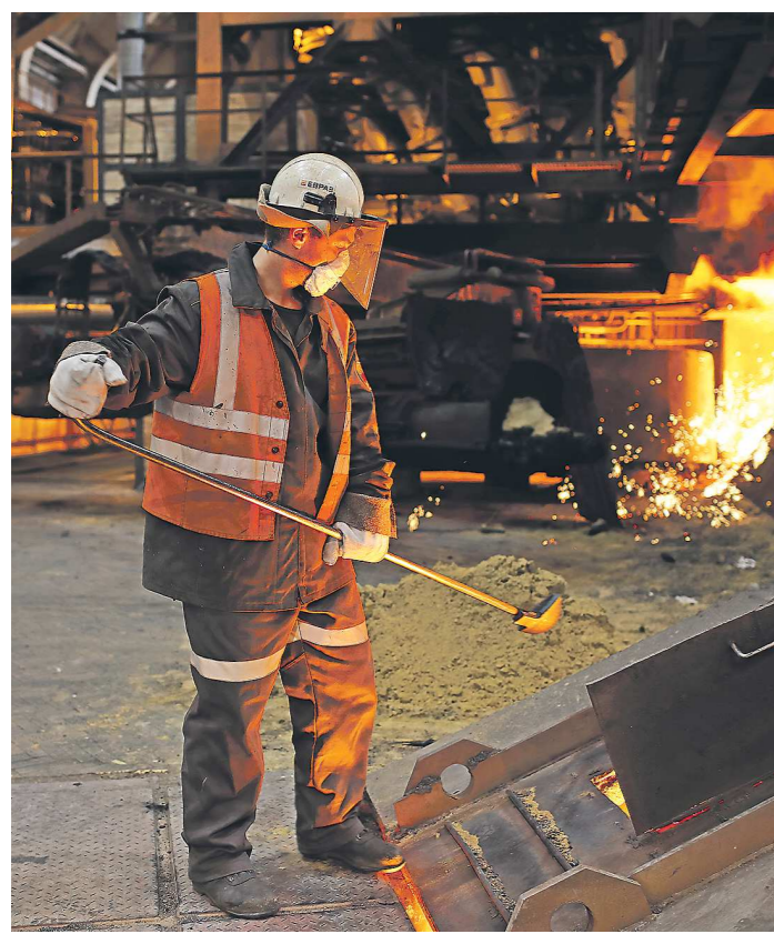
Медаль «Трудовая доблесть Урала» будут получать свердловчане, имеющие не менее 20 лет трудового стажа по рабочим профессиям

Евгений Куйвашев выступил с инициативой учредить медаль «Трудовая доблесть Урала»