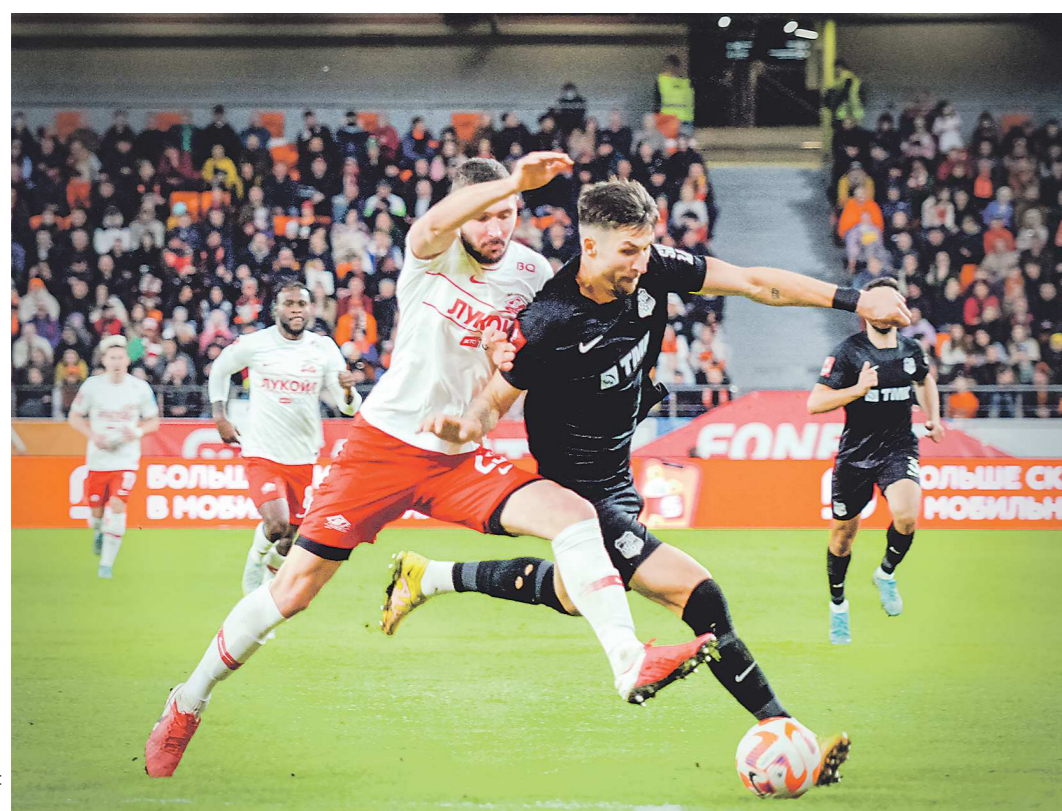
За последний месяц «Урал» и «Спартак» провели три матча, и «Урал» ни разу не проиграл: две ничьи в Москве (в чемпионате - 2:2, в Кубке - 1:1) и вторичная победа в Екатеринбурге (2:1)

На глазах у 25 тысяч зрителей «шмели» в Екатеринбурге обыграли действующего обладателя Кубка России