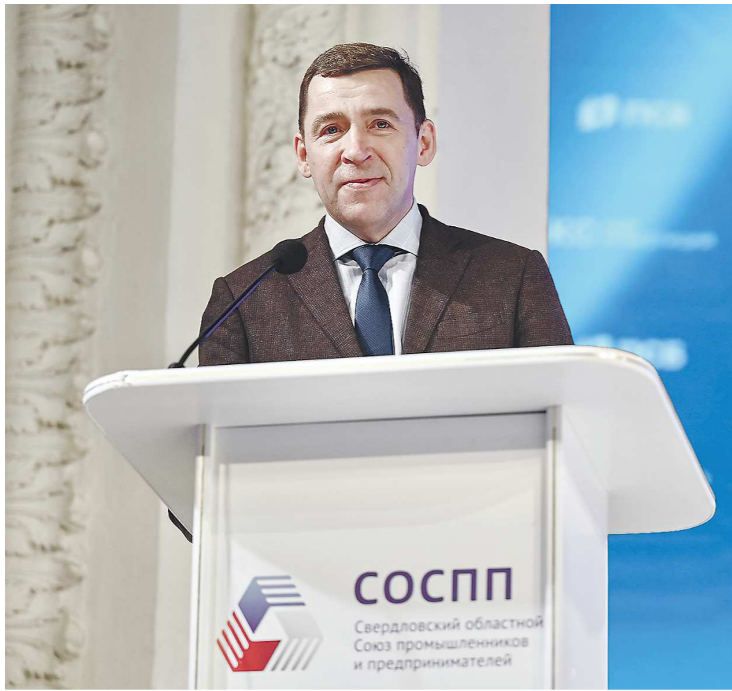
Евгений Куйвашев подчеркнул, что экономика региона, промышленный сектор в целом адаптировались к условиям санкционного давления

Вчера в Нижнем Тагиле прошло годовое общее собрание Свердловского областного союза промышленников и предпринимателей (СОСПП). В нем приняли участие губернатор Евгений КУЙВАШЕВ, президент РСПП Александр ШОХИН, полпред Президента РФ в УрФО Владимир ЯКУШЕВ и председатель Заксобрания Людмила БАБУШКИНА. Участники мероприятия обсудили стратегические планы региона в сфере импортозамещения и развития промышленного сектора. В частности, Александр Шохин заявил, что и в масштабах страны Свердловской области на этих направлениях отведена особая роль.