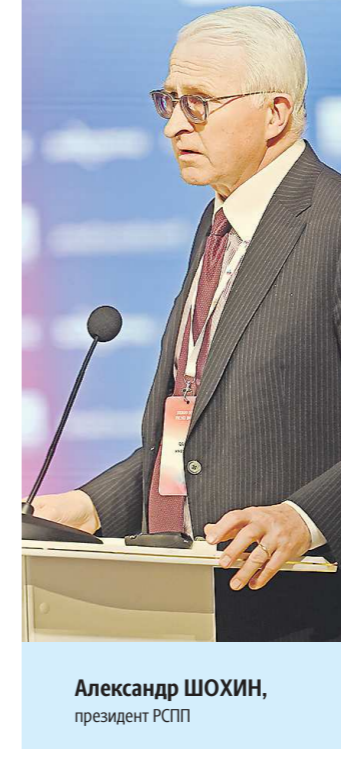
Александр ШОХИН, президент РСПП

«Действительно, даже коллеги, губернаторы видят, что потенциал обрабатывающей промышленности, машиностроения в частности, не только таких традиционных отраслей, как металлургия, например, – очень высокий в Екатеринбурге и в регионе в целом»