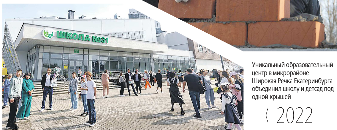
Губернатор стимулирует бизнес инвестировать в социальные проекты

ЕКАТЕРИНБУРГ / ДЕПАРТАМЕНТ ИНФОРМАТИКИ СВЕРДЛОВСКОЙ ОБЛАСТИ