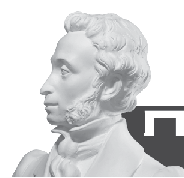
Выставку «Я – МЫ Екатеринбург» можно посетить по «Пушкинской карте»