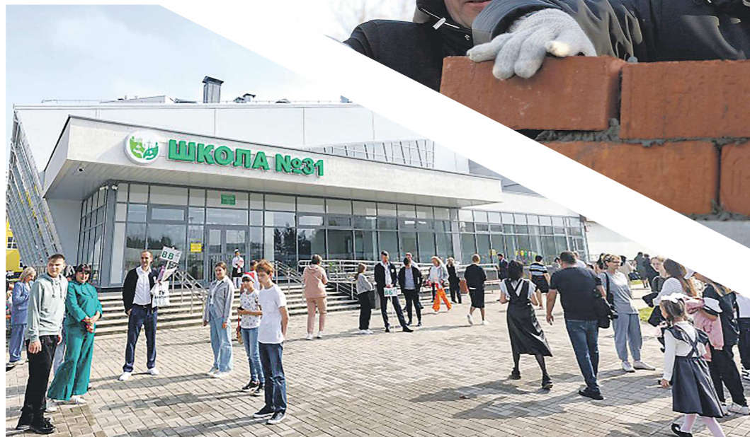
Губернатор стимулирует бизнес инвестировать в социальные проекты