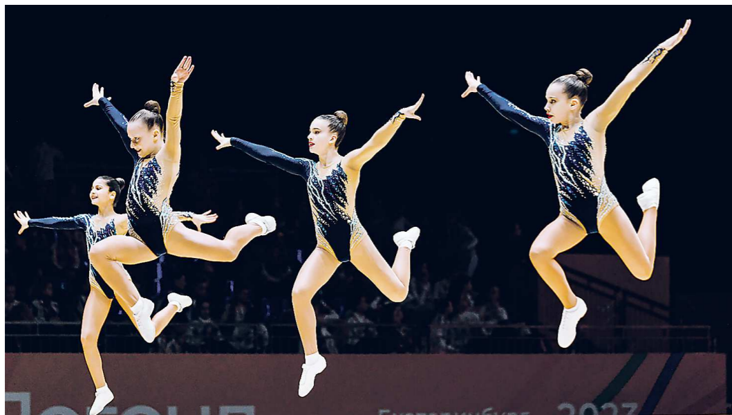
Соревнования по спортивной аэробике получили яркие и вызвали восторг у зрителей

Свердловские спортсмены стали победителями и призерами «Игр вызова легенд»