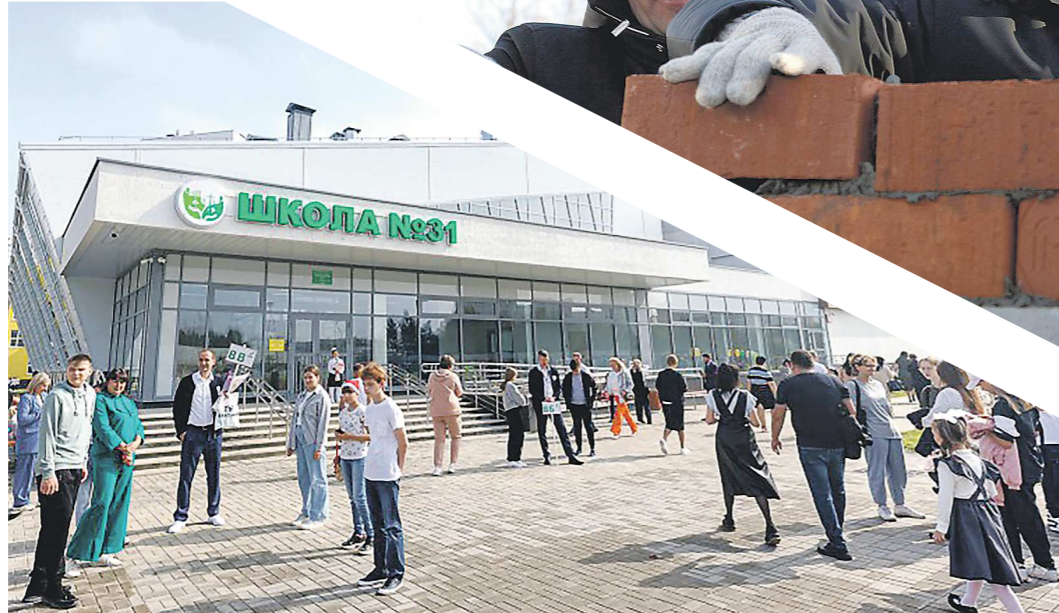
Губернатор стимулирует бизнес инвестировать в социальные проекты

Губернатор Евгений Куйвашев и генеральный директор «Группы ЛСР» Максим Соколов закладывают «первый камень» в основание нового образовательного центра