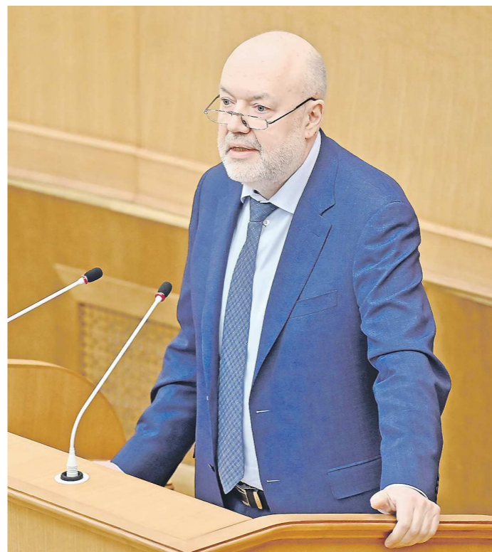
Первое весеннее заседание Заксобрания началось с выступления председателя комитета Госдумы по государственному строительству и законодательству Павла Крашенинникова

Подробности читайте в завтрашнем номере «ОГ»