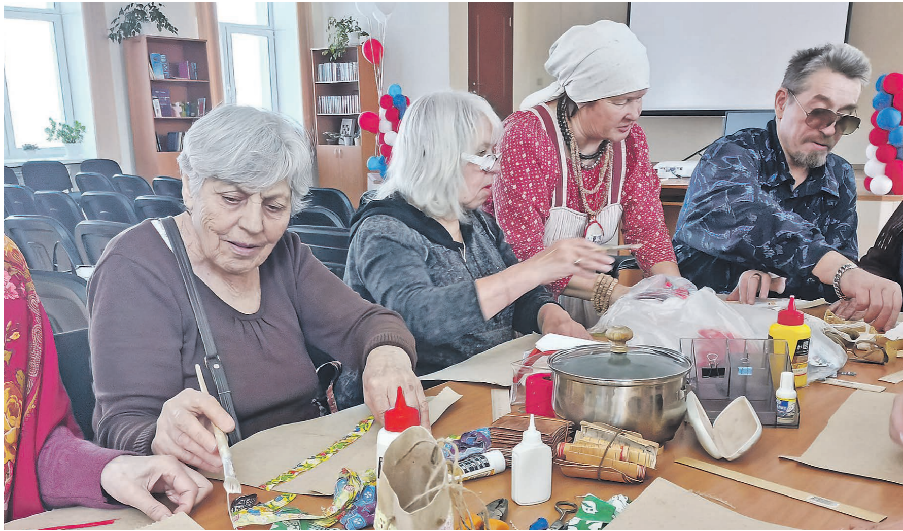
Среди мероприятий каждый найдет себе что-то по душе. На мастер-классе «Вечерки на посиделках у Пряжи» посетители центра изготавливают сувенир куклу-оберг – «Столбушку Берестушку»

В Свердловской области в рамках проекта Социального фонда России (СФР) началась работа по созданию Центров общения старшего поколения. Цель – организовать для людей пожилого возраста интересный и качественный досуг, дать им дополнительные возможности для общения и самореализации. Корреспонденты «Областной газеты», побывав в первом открывшемся в нашем регионе Центре в Каменице-Уральском, увидели, что современным пенсионерам интересны не только вязание и выпечка, но и, например, IT с гаджетами. Но все-таки главное для них – не чувствовать себя одиночками.