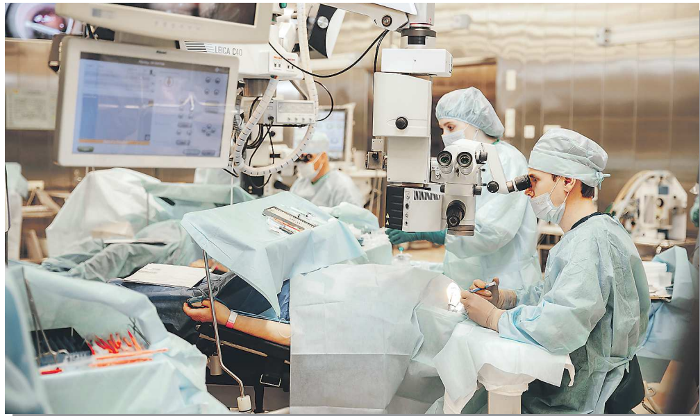
ЕКАТЕРИНБУРГСКИЙ ЦЕНТР МНТК «МИКРОХИРУРГИЯ ГЛАЗА» / Р

– Центр МНТК «Микрохирургия глаза» является клиникой с высочайшим рейтингом у пациентов. Рейтинг больницы, врачей определяется тем, насколько часто к тебе обращаются, какой у тебя поток, как ты лечишь больных, какие у тебя результаты. Мы ежедневно проводим более 250 операций и еще принимаем пациентов на лечение, консультации и так далее. В год через наш Центр проходит свыше 300 тысяч пациентов, проводится более 50 тысяч операций, 25 тысяч из которых – бесплатные для пациента, в рамках программы госгарантий. У нас самый большой среди всех регионов госзаказ на бесплатные глазные операции, это значит, что в нашей области такая помощь сейчас – самая доступная в России. Но даже этого недостаточно, чтобы принять по полису ОМС всех желающих сейчас и сразу.