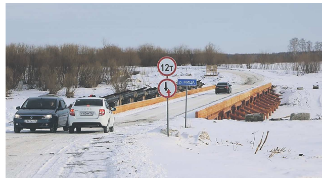
АДМИНИСТРАЦИЯ СЛОБОДО-ТУРИНСКОГО МР

Возле села открыли новый автомобильный мост через реку Ницу. Об этом сообщает газета «Коммунар» со ссылкой на администрацию муниципалитета.