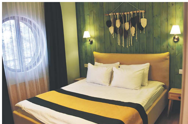
Так выглядит спальня в доме «Лисья нора». Над интерьером комнаты работали местные дизайнеры

Второй объект деревни – «Дом кулик» – построен в форме большой птицы, с внешней стороны здания просматриваются крылья, голова с большим клювом и хвост. Все тело кулика (то есть фасад) украшено черепицей оригинальной формы, напоминающей перышки. Интерьер тоже постарались украсить необычными предметами, созданными местными дизайнерами, – к примеру, прикроватными столиками из спилов, залитых эпоксидной смолой, и кухонной утварью необычной формы. Кстати, оба дома оснащены всеми необходимыми удобствами: Wi-Fi, телевизором, бытовой техникой и системой умного отопления.