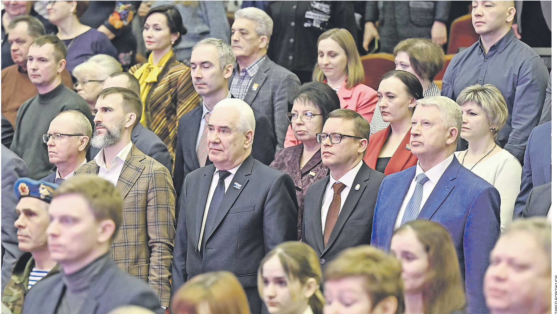
Пленарное заседание гражданского форума, объединившего в одном зале представителей всех слоев населения, началось с гимна Каменска-Уральского

Жители Каменска-Уральского уже почти тридцать лет вместе определяют стратегию развития города