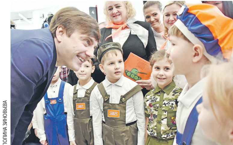
Сергей Кравцов пообещал нижнетагильским дошколятам организовать серию экскурсий на Уралвагонзавод

22 марта министр просвещения РФ Сергей КРАВЦОВ открыл на площадке МВЦ «Екатеринбург-ЭКСПО» Всероссийский фестиваль профессиональной ориентации школьников «Билет в будущее». Вместе с губернатором Евгением КУЙВАШЕВЫМ он осмотрел стенды выставочной программы фестиваля, пообщался со свердловскими студентами, учащимися школ и педагогами, вручил ведомственные награды и подписал ряд стратегических соглашений с крупными компаниями, реализующими программы ранней профориентации молодежи.