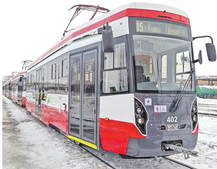
Новые трамваи от Уралтрансмаша уже прижились на тагильских улицах

– Безусловно. Еще в прошлом году мы начали капремонт школы № 48 на Голом Камне, нынче первого сентября мы ее запускаем. Недавно приступили к капремонту школы