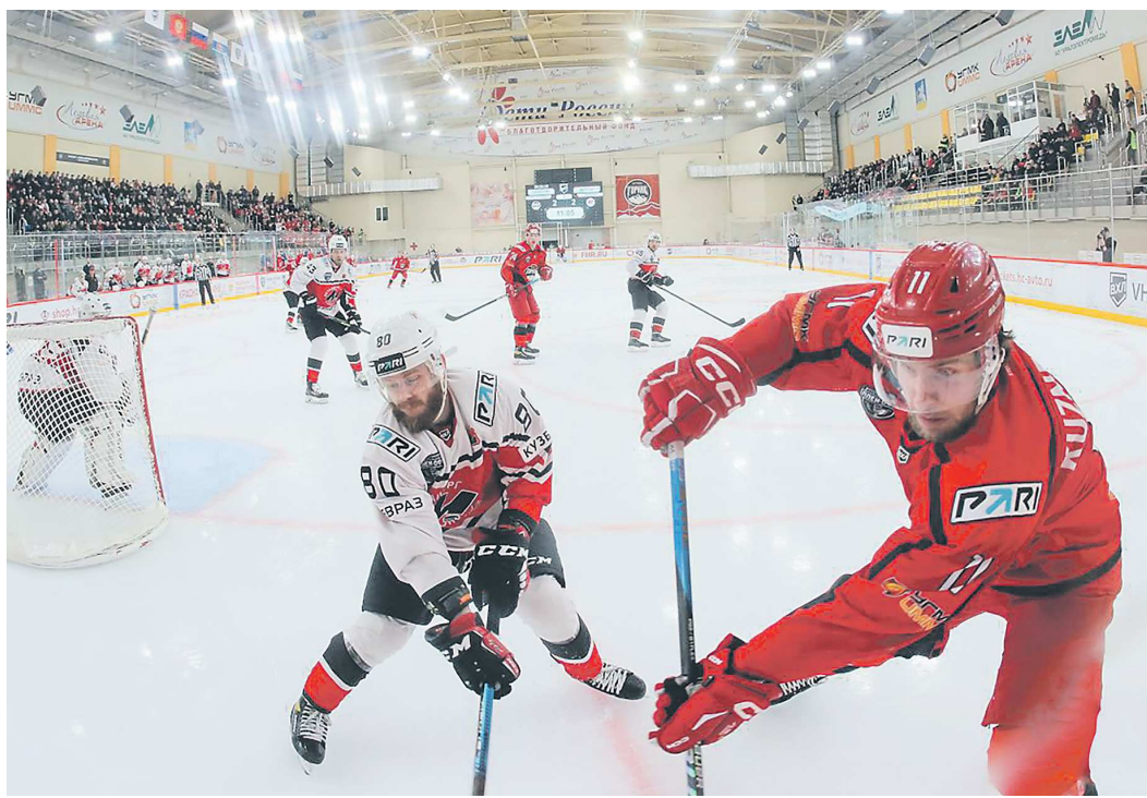
Атмосфера на шестом матче «Горняка» и «Металлурга» была на уровне КХЛ