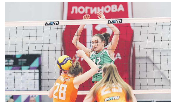
«Уралочка-НТМК» не знает побед уже два месяца

В 24-м туре чемпионата России среди женщин свердловская «Уралочка-НТМК» на своей площадке уступила красноярскому «Енисею» со счетом 2:3 (18:25, 29:27, 17:25, 27:25, 13:15). Наша команда потерпела седьмое поражение подряд, но хотя бы выиграла две партии: предыдущие шесть встреч «Уралочка» проиграла всухую.