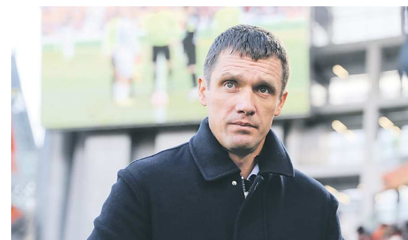
Виктор Гончаренко был удален с поля в концовке матча «Урал» – «Динамо»

Контрольно-дисциплинарный комитет Российского футбольного союза рассмотрел эпизод в концовке матча «Урал» – «Динамо», в котором был удален с поля главный тренер «Урала» Виктор ГОНЧАРЕНКО. За ненормативную лексику белорусский специалист дисквалифицирован на три матча.