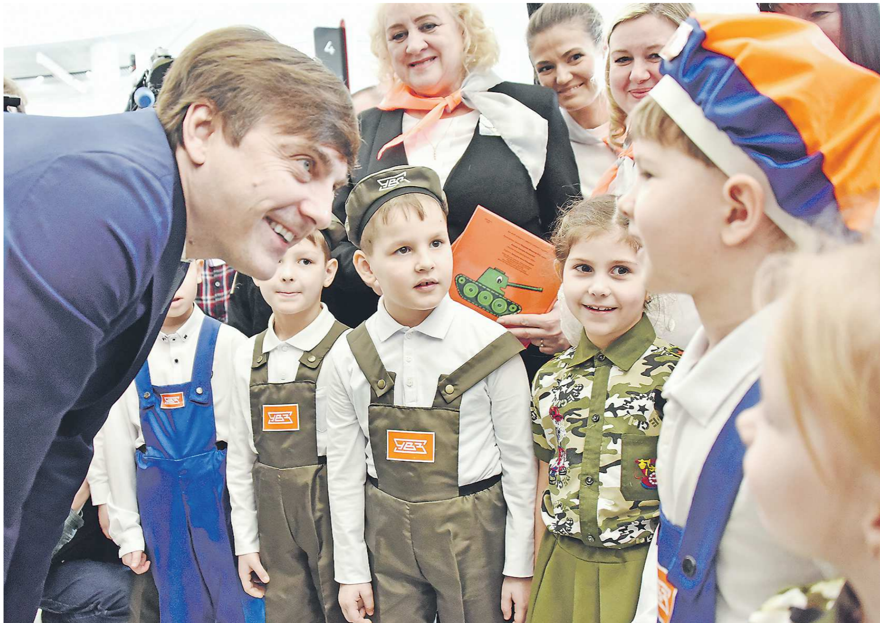
Сергей Кравцов пообещал нижнетагильским дошкольникам организовать серию экскурсий на Уралвагонзавод

– Российские железные дороги – один из главных стратегических партнеров системы образования страны. Железнодорожники одними из первых начали реализовывать федеральный проект «Профессионалитет», инициированный Президентом России Владимиром Путиным. С первых дней студенты колледжей проходят производственную практику. Подписанное соглашение – еще один шаг в нашей совместной работе. Наша общая цель – чтобы молодежь получала качественное профессиональное образование, а в дальнейшем –