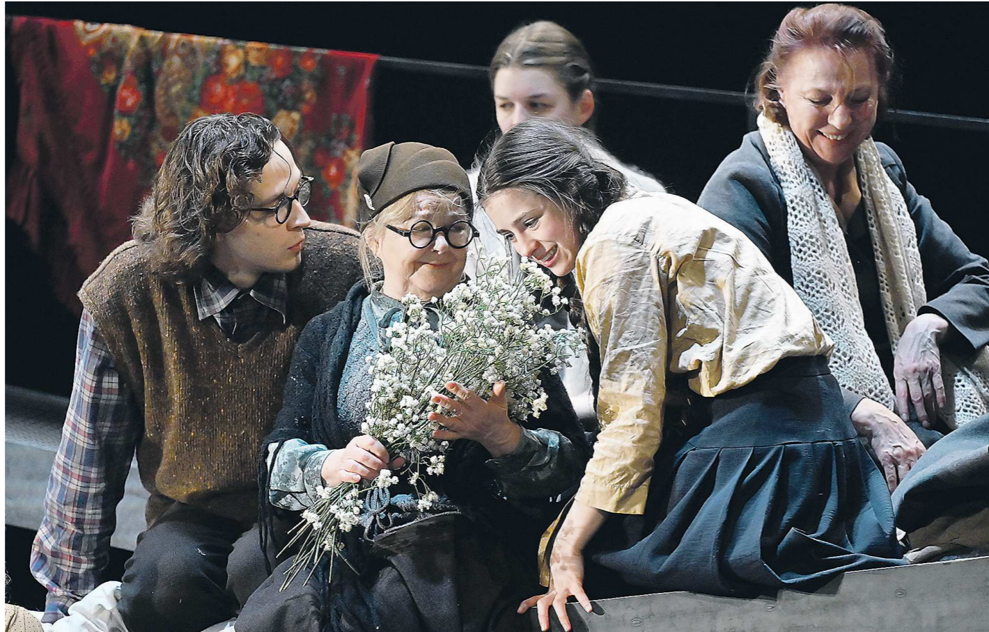
В темноте вагона букет цветов выглядит неестественно, но напоминает о мирных временах