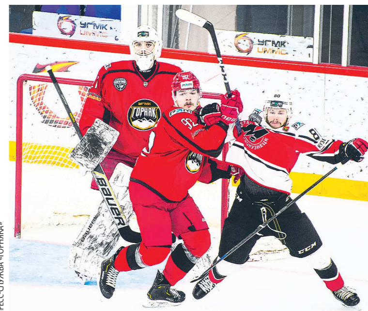
В четырех матчах серии из пяти команды смогли выиграть только в овертайме

Соперники очень быстро переходили из оборонительной в атакующую зону. Очень понравилась команда, но мы идем дальше. Как я и говорил вначале, у нашей команды есть характер, который мы и