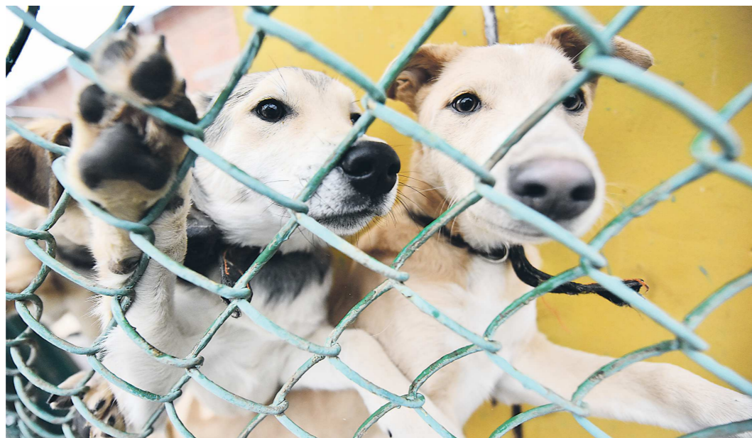
Отловленная собака должна быть вакцинирована, стерилизована и социализирована

Правительство Свердловской области утвердило новый Порядок контроля за бездомными животными. Документ разработан в соответствии с новыми методическими указаниями Правительства России, вступившими в силу 1 марта. Обязанности по учету животных, обитающих на улице, возложены на муниципалитеты. Их отловом, стерилизацией и чипированием продолжают заниматься специализированные организации. Кроме того, теперь им вменяется розыск прежних и поиск новых хозяев четвероногих. Зоозащитники нововведения поддерживают, особенно в части ужесточения контроля за исполнением специпорядками своих обязанностей.