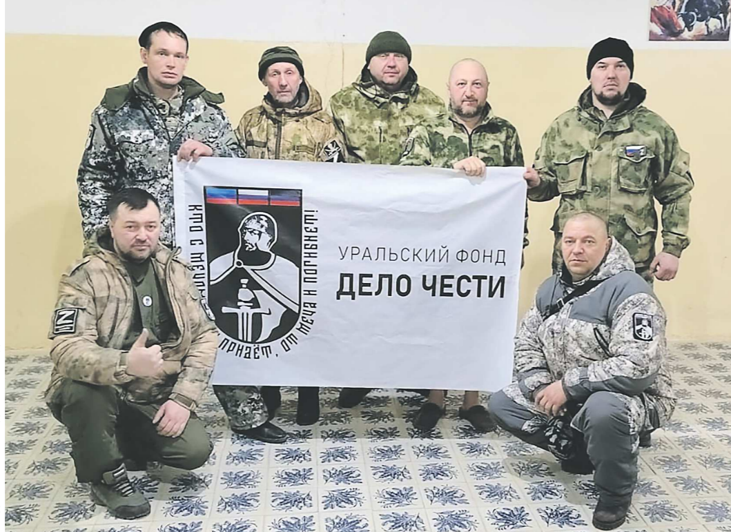
Неравнодушные каменцы выбрали символом своего фонда князя Александра Невского