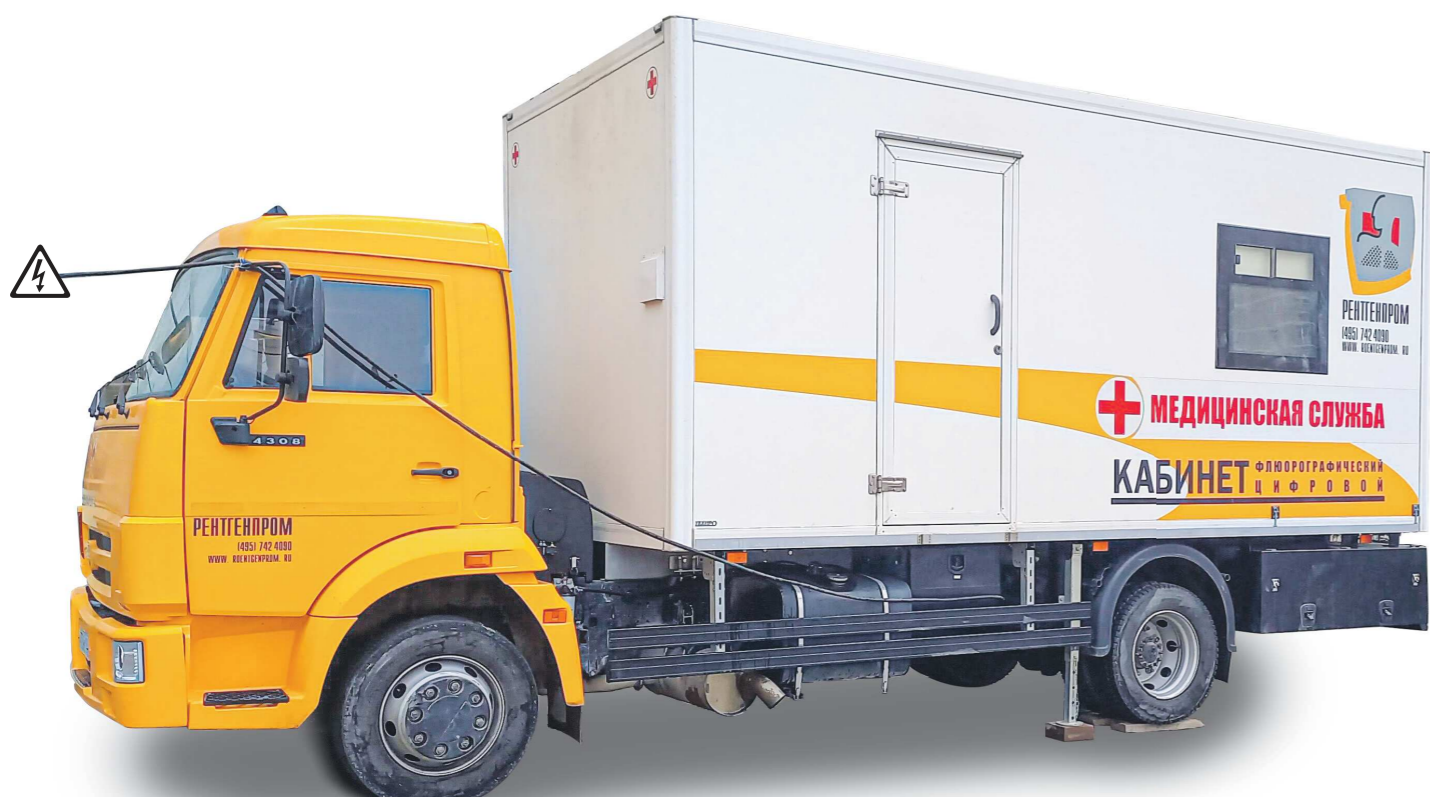
Уральцы могут быстро и бесплатно пройти обследование органов грудной клетки в передвижных цифровых рентгено-диагностических кабинетах