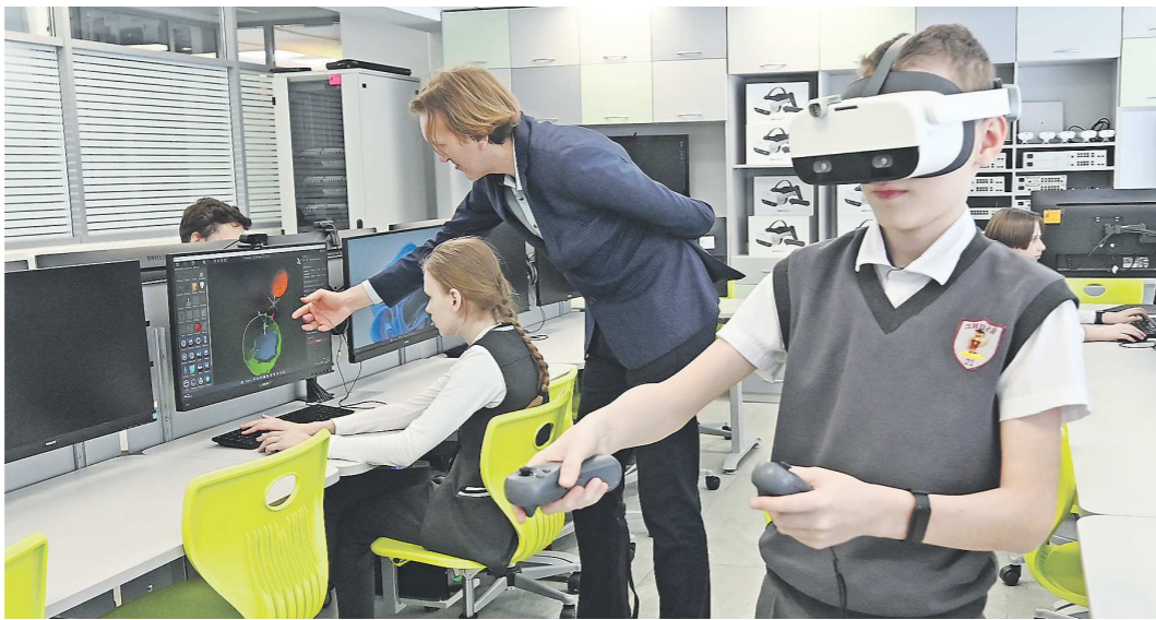
Эксперты считают, что опыт Уральской инженерной школы необходимо распространять на другие регионы России