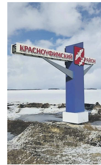
АДМИНИСТРАЦИЯ МО КРАСНОУФИМСКИЙ ОКРУГ

Пятиметровая конструкция, выполненная в цветах российского триколора, с гербом района посередине, заменила стоявший на этом месте неприглядный железный указатель. Средства на установку стелы были выделены из местного бюджета. На одной ее стороне – надпись «Красноуфимский район», на другой – пожелание «Счастливого пути». Планируется, что такая же стела появится на въезде со стороны Артинского района.