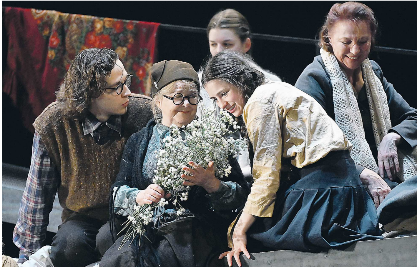
В темноте вагона букет цветов выглядит неестественно, но напоминает о мирных временах