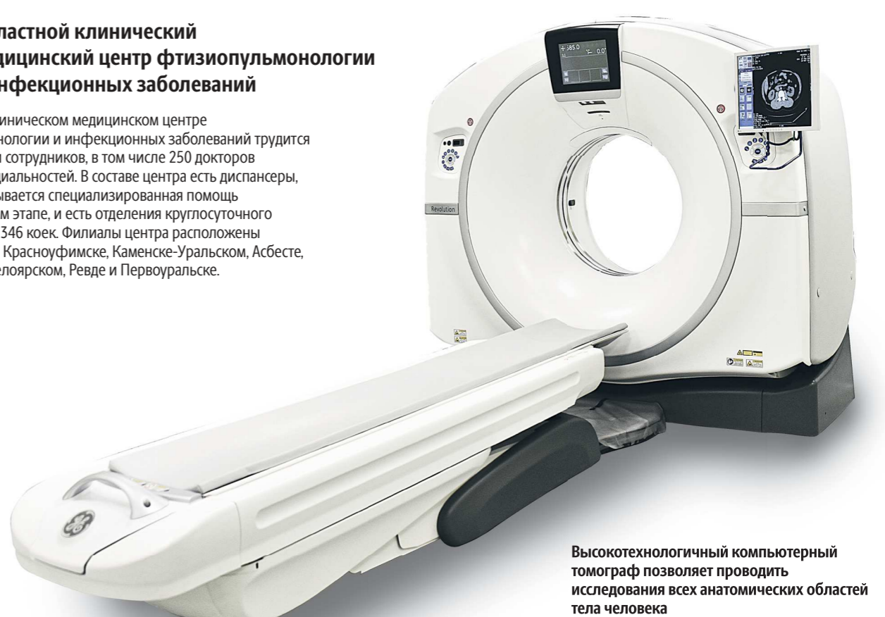
Высокотехнологичный компьютерный томограф позволяет проводить исследования всех анатомических областей тела человека

В Областном клиническом медицинском центре фтизиопульмонологии и инфекционных заболеваний трудится полторы тысячи сотрудников, в том числе 250 докторов различных специальностей. В составе центра есть диспансеры, в которых оказывается специализированная помощь на амбулаторном этапе, и есть отделения круглосуточного стационара на 1346 коек. Филиалы центра расположены в Тавере, Ирбите, Красноуральске, Каменске-Уральском, Асбесте, Богдановиче, Белоярском, Ревде и Первоуральске.