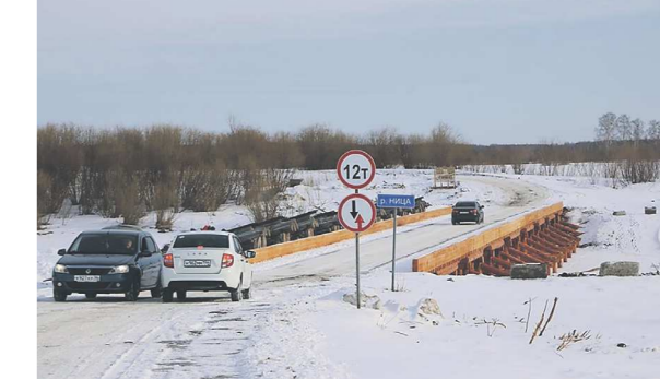
АДМИНИСТРАЦИЯ СВОБОДО-ТУРИНСКОГО РАЙОНА

Возле села открыли новый автомобильный мост через реку Ницу. Об этом сообщает газета «Коммунар» со ссылкой на администрацию муниципалитета.