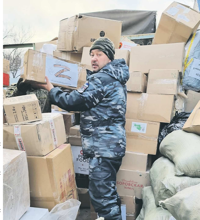
Груз доставлен к месту назначения – прямо на передовую

Активно помогают и пенсионеры, и молодежь. Кто-то шьет теплые белье и спальные мешки, плетет маскировочные сети. Кто-то покупает и приносит берцы и так необходимые в сыжном южном климате резиновые сапоги, дождевики.