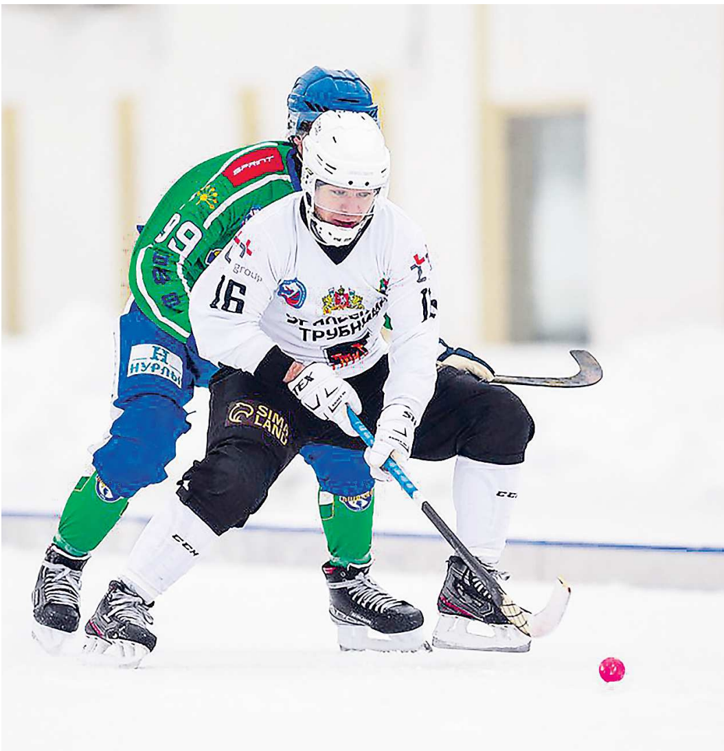
В XXI веке «Уральский трубник» только один раз занимал место ниже, чем в этом году: в сезоне 2012–2013 команда финишировала 14-й

Но надежда на улучшение ситуации в будущем есть