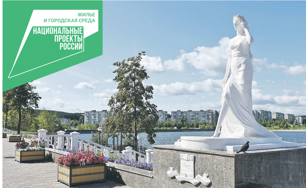
Набережная в Кrasnoturyинске после реконструкции по проекту ФКГС

В Свердловской области на рейтинговое голосование будут представлены 148 объектов в 55 муниципалитетах. В адресный перечень территорий для благоустройства на следующий год будут включены те из них, которые получают наибольшее число голосов. Процедура волеизъявления устроена максимально просто. Ее можно пройти на сайте платформы 66.gorodsreda.ru , зареги-