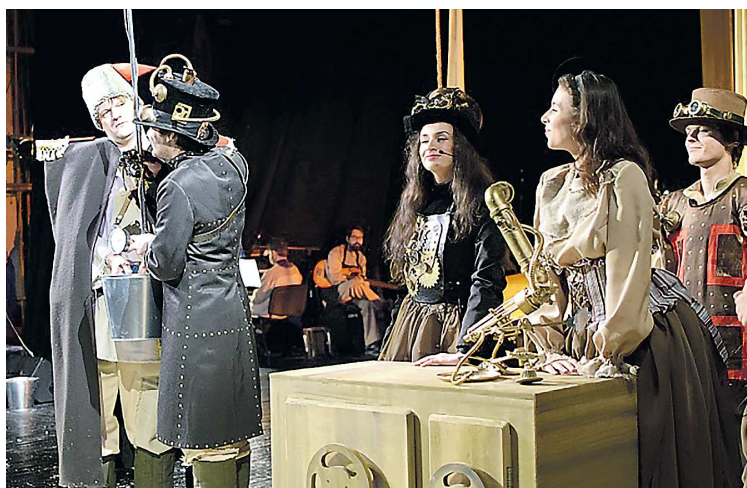
Сцена из спектакля «Левша», которым открылись гастроли Донецкого республиканского молодежного театра в Свердловской области

Открылся тур по Свердловской области спектаклем «Левша». Создан он был в 2018 году, в инсценировке театра. Авторы постановки уточняют, что хоть