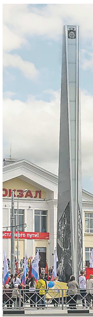
Стела «Город трудовой доблести» на Привокзальной площади в Нижнем Тагиле встречает гостей города