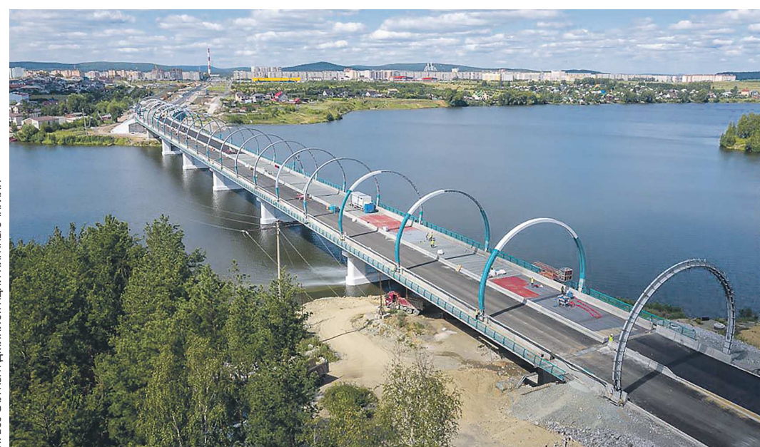
Август 2022-го. Мост через нижнетагильский пруд за неделю до открытия