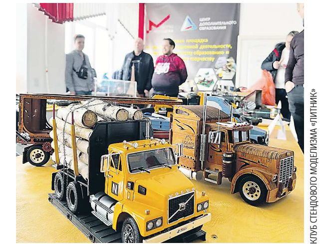
КЛУБ СТЕНОВОГО МОДЕЛИЗМА «ЛИТНИК»

В поселке открылась межрегиональная выставка стенового моделизма «Оружие побед», посвященная 80-летию Уральского добровольческого танкового корпуса, пишет газета «Пламя».