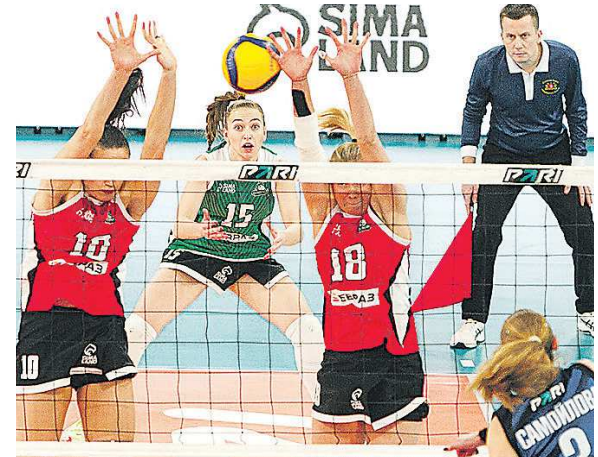
«Уралочка» уступила в Челябинске впервые с 2009 года. В последних шести матчах сезона свердловская команда не смогла выиграть ни одной партии

В 23-м туре чемпионата России свердловская «Уралочка-НТМК» проиграла в Челябинске местному клубу «Динамо-Метар» со счетом 0:3. Подопечные Николая КАРПОЛЯ потерпели седьмое поражение подряд и опустились в турнирной таблице на 12-е место.