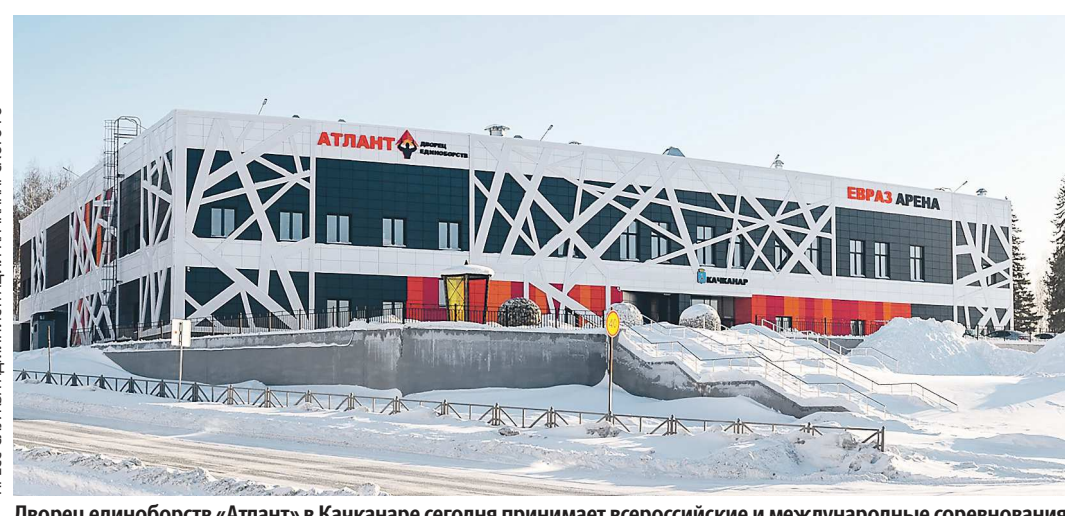
Дворец единоборств «Атлант» в Качканаре сегодня принимает всероссийские и международные соревнования