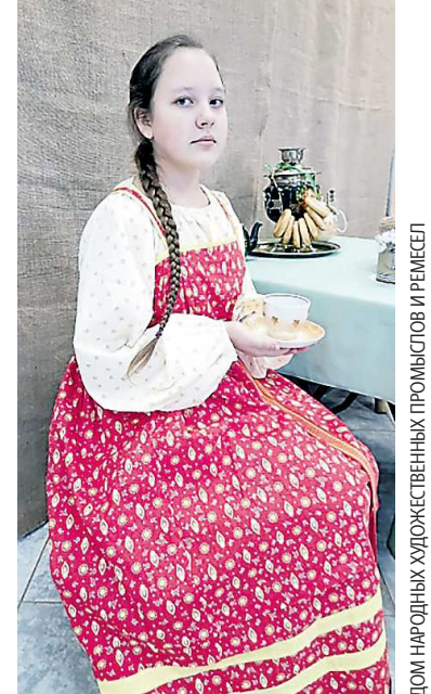
ДОМ НАРОДНЫХ ХУДОЖЕСТВЕННЫХ ПРОМЫСЛОВ И РЕМЕСЕЛ

Как сообщает издание «Новая жизнь», необычную акцию организовали в канун Международного женского дня. Любая посетительница может примерить старинную женскую одежду и почувствовать себя хозяйкой русской избы. Участницам предлагается сделать фото в нескольких локациях – у русской печи с горшочком в руках, за ткацким станком и так далее. Жительницы и гости города идею оценили и с удовольствием делятся ретроснимками в соцсетях. Посетить селфи-зону можно в течение всего марта.